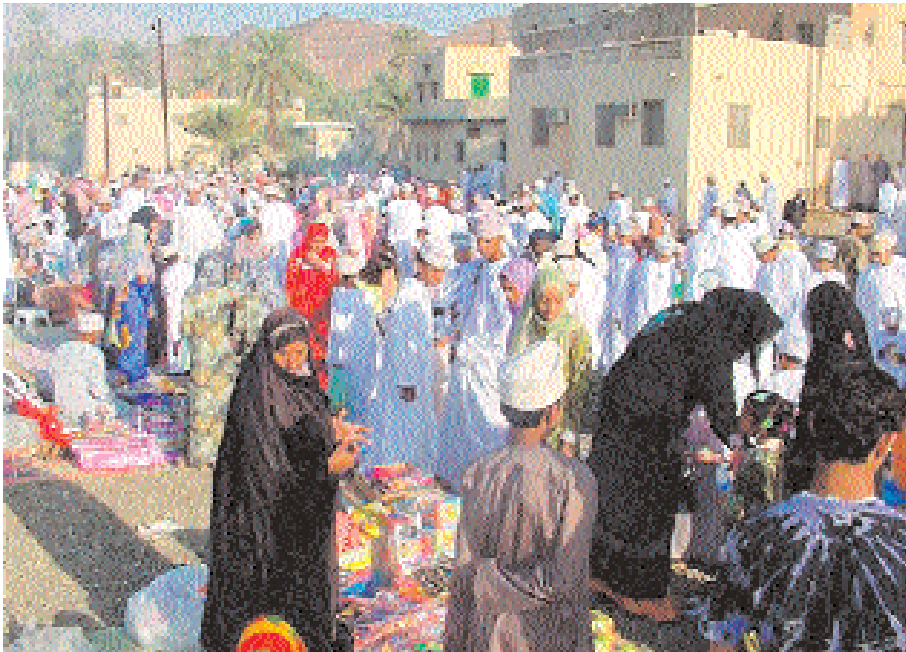
■ العيود بولاية سمازل

نزوى - من سالم السالمي صور - من عبدالله باعولي سمازل - الباطن العوابي - من حمود الخروصي