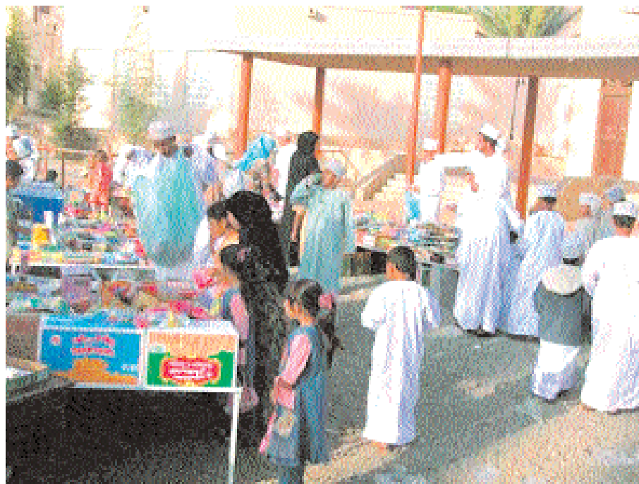
■ فرحة الأطفال بالعيد بولاية نزوى