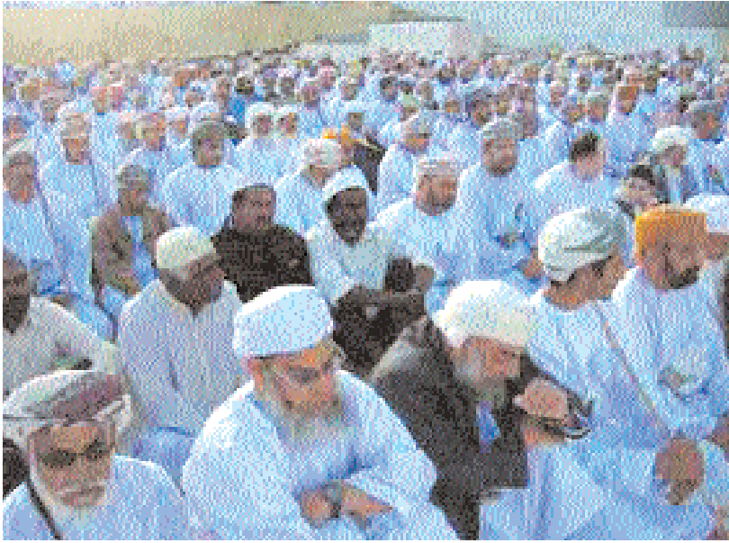
..ويستمعون إلى خطبة العيد بالعوابي