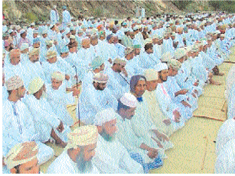
..ويستمعون إلى خطبة العيد بسمازل