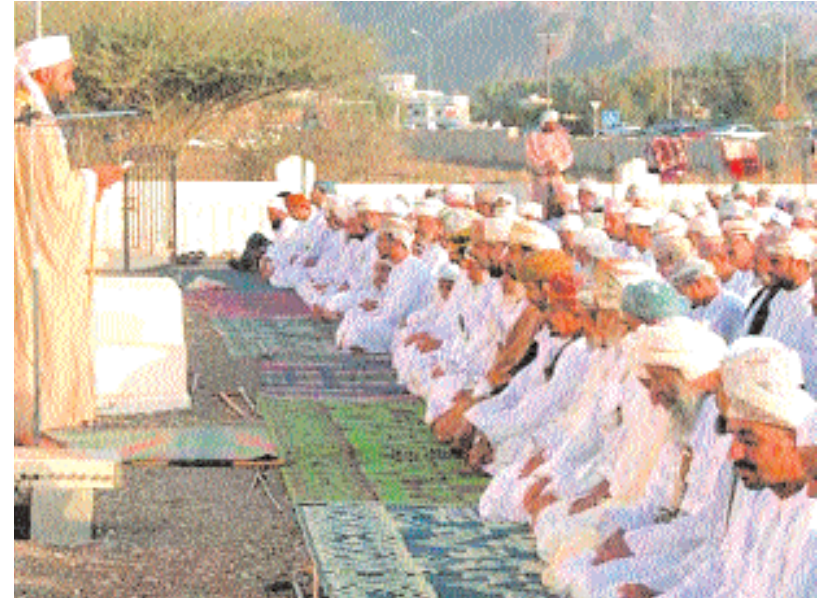
■ جموع المصلين يستمعون إلى خطبة العيد بنزوى