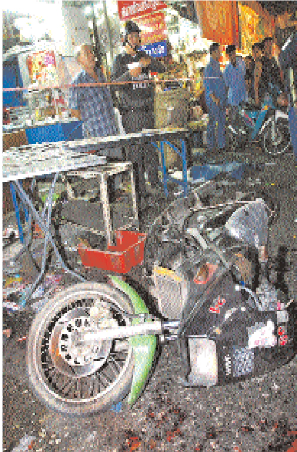
دراجة نارية محطمة بينما يقوم رجال شرطة تايلانديون (وسط) بفحص الدمار الذي سببه انفجار قنبلة في احد الاسواق في بانكوك امس.