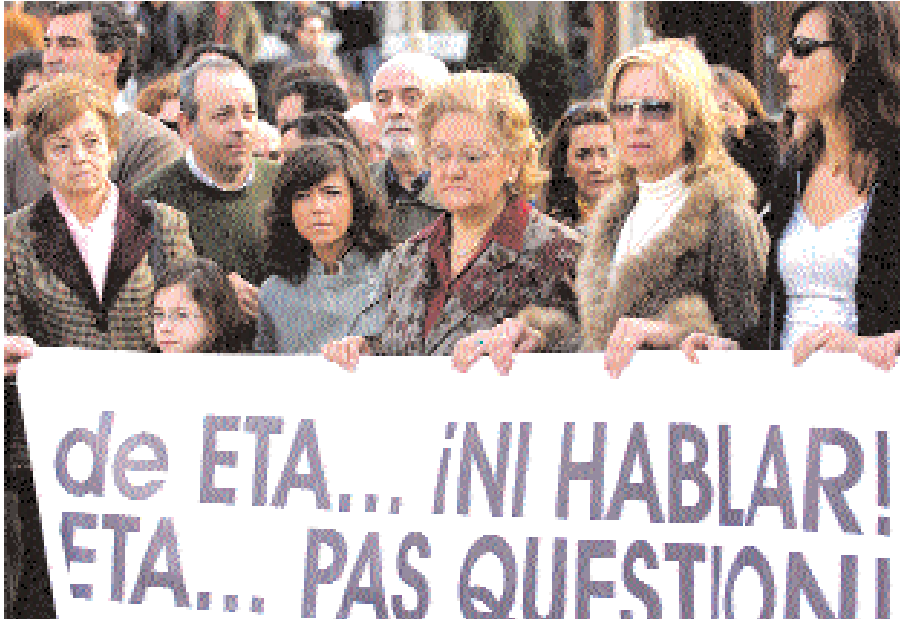
■ أسبان يتظاهرون امس في مدينة بلباو بإقليم الباسك الاسباني احتجاجا على التفجير الذي وقع امس الاول في مطار مدريد وتبنته منظمة «ايتا»

■ مدريد - ا.ف. ب: احتشد آلاف المتظاهرين أمس على مئاتات تطالب بـ "استقالة ثاباتيرو" في ساحة لابورتا ديل سول بوسط مدريد غداة اعتداء بالسيارة المفخخة في مطار العاصمة نسب الى منظمة ( ايتا ) الباسكية. وفي هذا التجمع الذي دعت اليه رابطة ضحايا الارهاب ركز المتظاهرون وهم يرفعون اعلاما اسبانية احتجاجهم على سياسة رئيس الحكومة الاشتراكي خوسيه لويس رودريغيز ثاباتيرو اكثر من منظمة الايتا ، على ما افادت مراسلة لوكالة فرانس برس . وكانت رابطة ضحايا الارهاب المعقبة من المعارضة المحافظة دعت امس الاول الى هذه التظاهرة لـ "ترفع الصوت عاليا بأنه لا يجوز التفويض مع القتل في ايتا" . بعد ان انتهكت المنظمة الانفصالية الباسكية المسلحة في الواقع وقف اطلاق النار الذي بدأ تطبيقه في ٢٢ مارس الماضي . ولا يزال اكوادوريان في عداد المحقوبين في المطار وفي حال العثور عليهما ميتين فإنهما سيكونان اول