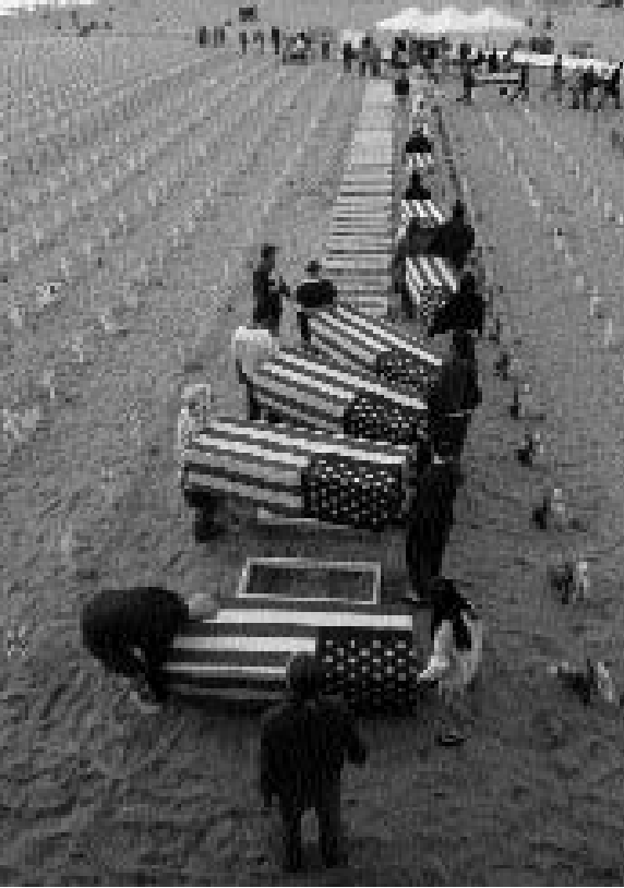
ناشطون يحملون نماذج لنعوش فارغة في سانتا مونيكا أمس الاول مع وصول عدد القتلى في صفوف القوات الأميركية في العراق إلى ٣ آلاف روبرتر

■ واشنطن - رويترز: تعهدت جماعات سلام أميركية بأن تستهل العام الميلادي الجديد بتنظيم مسيرات واحتجاجات على ارتفاع عدد الجنود الاميركيين الذين قتلوا في العراق إلى ٣٠٠٠ ومواصلة دعوتها لانهاء الحرب. وقالت جماعة (متحدون من أجل السلام والعدالة) في موقعها على شبكة الانترنت "ينبغي أن نقف شهودا على هذا الحدث المأساوي على الرغم من أن كثيرين بدأوا بالفعل احتفالاتهم بالعام الجديد". ووفقا لما ورد في موقع الجماعة أمس الاول قتل جندي أميركي من جراء انفجار قنبلة مزروعة على جانب الطريق في العاصمة العراقية بغداد ليصل عدد الجنود الاميركيين الذين قتلوا في العراق إلى ٣٠٠٠ منذ الغزو الذي قادته الولايات المتحدة عام ٢٠٠٣. وقامت جماعة من قدامى المحاربين الاميركيين لتذكّر الجنود الاميركيين الذين قضاوا حتفهم في العراق باضافة الشموع للتذكير بوصول عدد القتلى إلى ٣٠٠٠. كما دعت جماعة (لجنة خدمة الاصدقاء الاميركيين) النشطاء المناهضين للحرب للقيام بمسيرات في أنحاء الولايات المتحدة حدادا على القتلى الاميركيين والعراقيين في الحرب. وفي بيتسبرغ احتشد نشطاء السلام عند مركز تجنيد الجيش للتذكير ببلوغ عدد القتلى من الجنود الاميركيين في العراق ٣٠٠٠ قتيلا. كما تقرر تنظيم مسيرة أخرى على ضوء الشموع اليوم قرب مجلس المدينة في