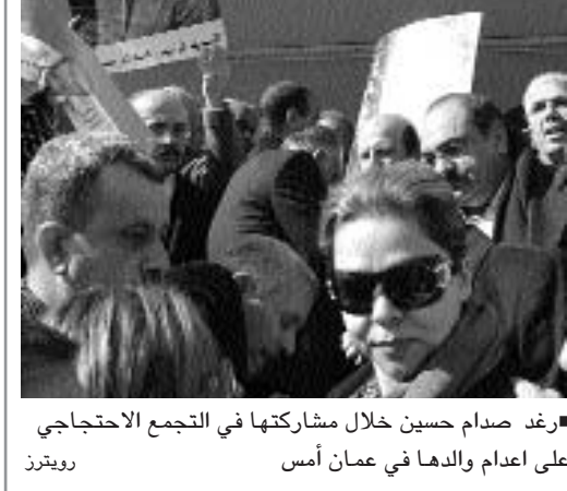
رغد صدام حسين خلال مشاركتها في التجمع الاحتجاجي على اعدام والدها في عمان أمس