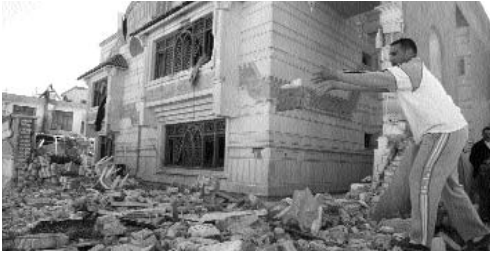
عراقي يتفقد طعام منزل تابع للدكتور صالح المطلق رئيس جبهة الحوار الوطني العراقي بعد غارة أميركية على المبنى في بغداد أمس