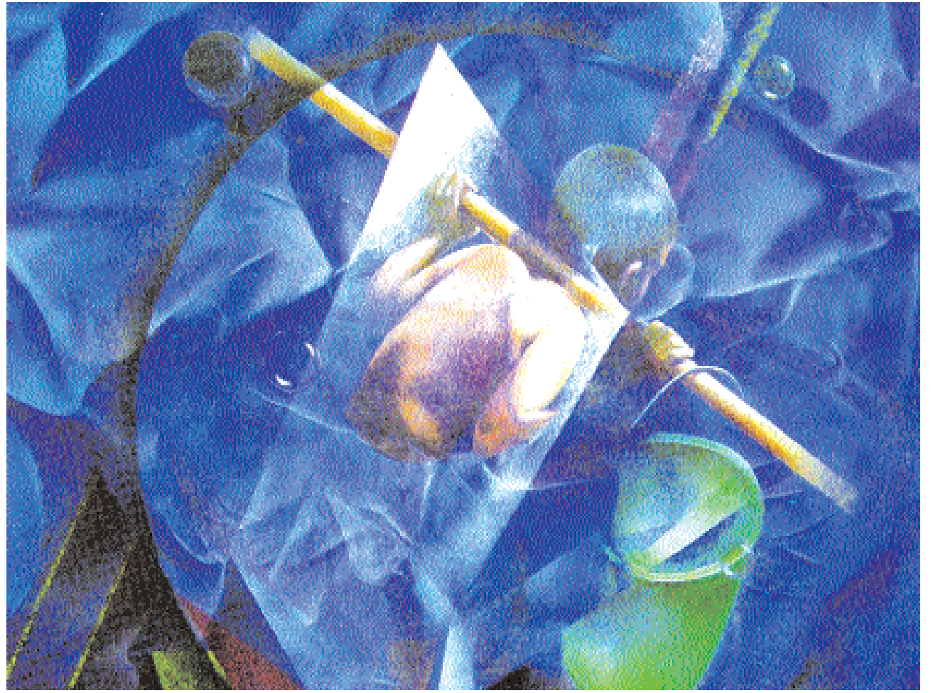
لوحمة للفنانة التشكيلية فتراناج بنت هلال الاسماعيلی