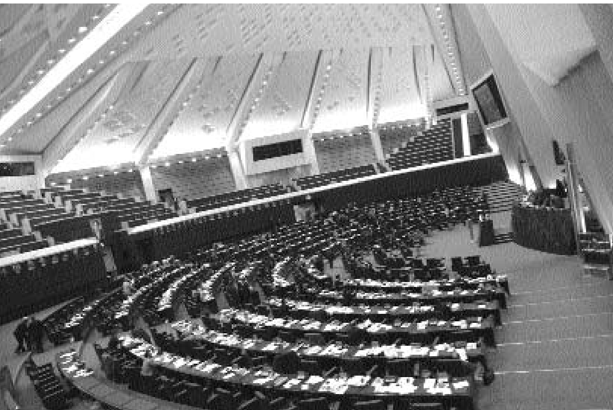
■ منظر عام للبرلمان الإيراني خلال جلسة انعقاده في طهران أمس حيث تحدى البرلمان معارضة الحكومة لترسيم قانون يرفع الحد الأدنى للسن القانونية للمشاركة في الانتخابات التشريعية والرئاسية من ١٥ إلى ١٨ سنة

■ قال الرئيس الإيراني محمود أحمددي نجاد امس ان بلاده لن تتراجع عن حقها في التكنولوجيا النووية وان قرار العقوبات الذي أصدره مجلس الامن غير ملزم بالنسبة لها. وقال أحمددي نجاد في خطاب لآقاء أمام حشد في مدينة الاهواز بجنوب ايران ونقله التلفزيون: الامة الإيرانية تسم بالحكمة وستتمسك بعملها النووي وهي مستعدة للدفاع عنه بشكل كامل.. حسب قوله. وأضاف: ان قرار الامم المتحدة ضد النشاط الذري الإيراني غير ملزم بالنسبة للإيرانيين. انه غير مشروع وذو دوافع سياسية.. على حد تعبيره. ويوم الأربعاء الماضي أقر البرلمان الإيراني مشروع قانون يلزم الحكومة (بإعادة النظر) في تعاونها مع الوكالة الدولية للطاقة الذرية اثر قرار الامم المتحدة. لكن القانون ترك للحكومة مهمة تحديد كيفية إعادة النظر في التعاون مع الوكالة ولم يعلن حتى الآن اي إجراء ملموس. وللزعيم الإيراني الأعلى آية الله علي خامنئي الكلمة الأخيرة في الأمور النووية وغيرها لكنه أكد أيضا مثل أحمددي نجاد أن بلاده لن تتخلى عن نشاطها الذري. وقال أحمددي نجاد ان برنامج إيران النووي لا يشكل تهديدا للاستقرار