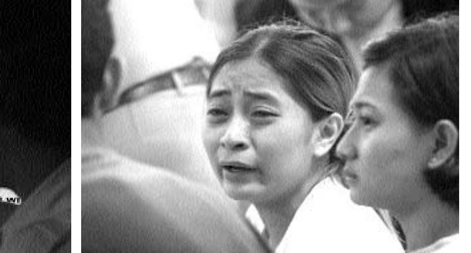
■ اندونيسيات يبكين أقاربهن ضحايا الطائرة (ادم ايربوينغ ٧٣٧ - ٤٠٠) التي تحطمت جراء الأمطار الغزيرة أمس الأول.