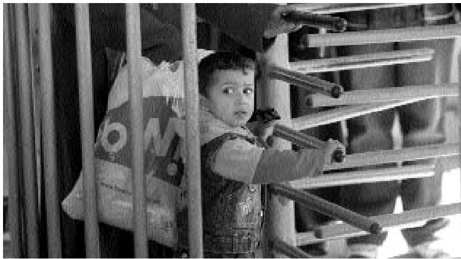
■ طفل فلسطيني يتألم لعبور نقطة تفتيش تابعة للجيش الاسرائيلي بالقرب من مدينة نابلس

■ نقلت صحيفة (يديעות أحرانيت) الإسرائيلية في عددها الصادر أمس الأربعاء، عن وزير التخطيط الإسرائيلي افيغور ليبرمان قوله: على إسرائيل ان تضع لنفسها هدفا سياسيا وذلك بأن تنضم في غضون ٥ سنوات إلى الاتحاد الأوروبي والناتو بمكانة عضو كامل الصلاحيات. ويرأى ليبرمان فان الانضمام إلى الناتو كفيل بردع ايران من مهاجمة إسرائيل خشية أن تدخل في مواجهة عسكرية مع كل دول الحلف. وقال ليبرمان: مكافحة إسرائيل للإرهاب ليست مجرد كغاح سياسي من جانبها بل من جانب كل العالم الحر، وواضح اننا نوجد على خط الجبهة، ولكن إسرائيل هي مجرد العذر، فالعمليات التي وقعت في مدريد، في لندن وفي بالي وفي العراق تثبت أننا نتصدى لشيء يمثل كل العالم الحر، وليس صدفة أن يقترح احدي نجاد نقل كل اليهود الى أوروبا، فهذه حرب كل العالم الحر. على حد قوله.■