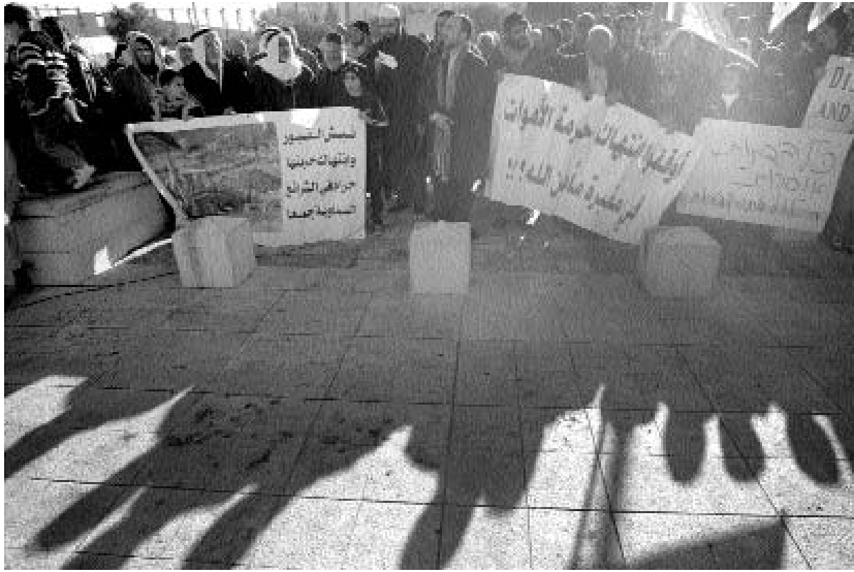
■ فلسطينيون يحملون لافتات خلال إحتجاج على إنشاء ما يسمى متحف التسامح الاسرائيلي فوق مقابر إسلامية بالقدس المحتلة أمس