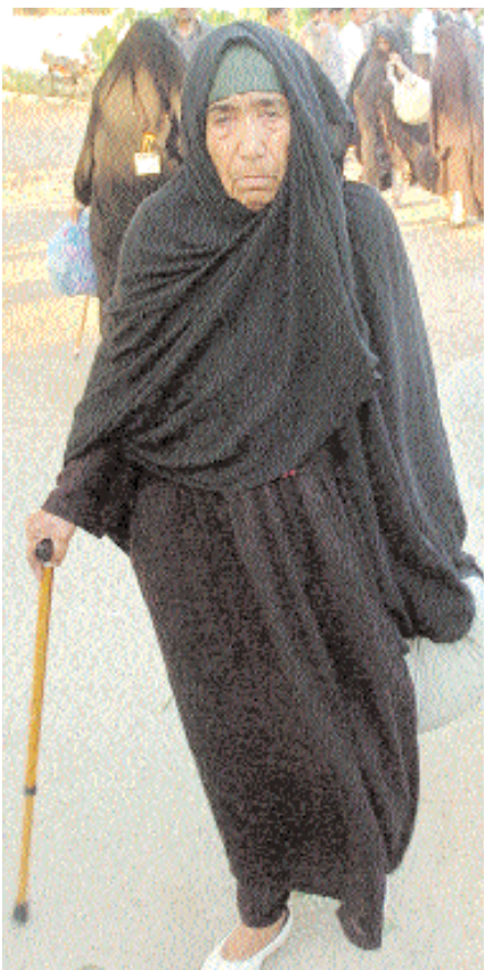
عجوز أفغانية تتوكأ على عصاها وهي خارجة من السجن بعد الإفراج عنها في كراتشي امس حيث تعزز السلطات الباكستانية ترحيل ١٩٨ لاجئا أفغانيا إلى بلادهم

قندهار - عواصم - وكالات: أعلن التحالف العسكري بقيادة الولايات المتحدة امس الاثنين انه نفذ عملية في ولاية هلمند (جنوب أفغانستان) كانت تستهدف أحد المقربين من الزعيم الروحي لطالبان الملا محمد عمر وأدت إلى مقتل العديد من عناصر الحركة. وقالت الشرطة ان ستة من عناصر طالبان وخمسة شرطين قتلوا مساء الأحد في مواجهات في ولايتي ارزغان وزابلون جنوب أفغانستان. وشنت قوات التحالف والجيش الأفغاني صباح الاثنين هجوما على مجموعة من عناصر طالبان قرب بلدة جيريشك (٣٥ كلم شمال عاصمة ولاية هلمند) حسبما جاء في بيان صادر عن التحالف. وأضاف البيان ان الهجوم نفذ استنادا إلى معلومات جمعت حول احد قادة طالبان ينشط في ولاية قندهار. وكان الشخص المستهدف على صلة بالملا محمد عثمانى والملا محمد عمر الغار. ولم يكشف البيان هوية القتلى او ما اذا قُضى في هذه العملية. وكان الملا اختر محمد عثمانى القائد العام لقوات طالبان في الجنوب والمقرب من زعيم تنظيم القاعدة اسامة بن لادن، قتل في غارة في ديسمبر حسب التحالف. من جهته جدد وزير الدفاع الأميركي روبرت غيتس امس في اسلام اباد التزام الولايات المتحدة الطويل الامد في أفغانستان مشددا على الخطأ الذي ارتكب بعدم الاهتمام بهذا البلد بعد انسحاب الجيش السوفياتي منه العام ١٩٨٩. وقال غيتس بعد الانسحاب السوفياتي ارتكبت الولايات المتحدة خطأ. لقد اهلنا أفغانستان. وهيمن متطرفون (عليها) وكانت النتيجة بالنسبة للولايات المتحدة هجمات ١١ سبتمبر ٢٠٠١.