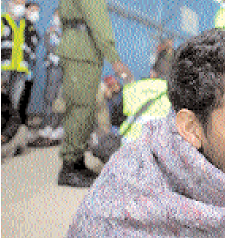
مهاجر تم إنقاذه يستريح في ميناء موديبو بموريتانيا تمهيدا لترحيله إلى بلاده ضمن ٤٠٠ من ضحايا الهجرة غير الشرعية جنحت سفينتهم على شواطئ موريتانيا مؤخرا

وأضاف خلال مؤتمر صحافي في ختام اول زيارة له لباكستان لن ترتكب الخطأ ذاته. نحن في أفغانستان على المدى الطويل. وأجرى وزير الدفاع الأميركي محادثات مع الرئيس الباكستاني برويز مشرف في اطار جهود تبذلها واشنطن للحصول على دعم تمهيدا لشن هجوم على حركة طالبان في أفغانستان في الربيع. من جانبه صرح القائد السابق للقوات الأمريكية في أفغانستان ان الولايات المتحدة تعتقد ان زعيم