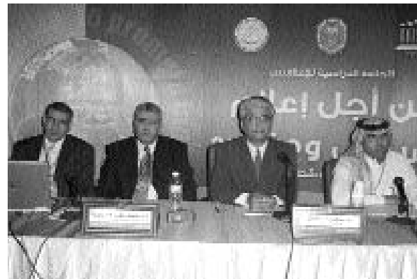
أحدى جلسات حلقة العمل