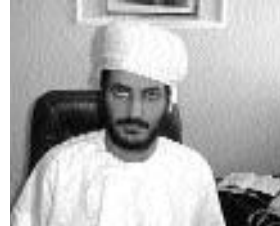
خليفة بن حمد السعدي