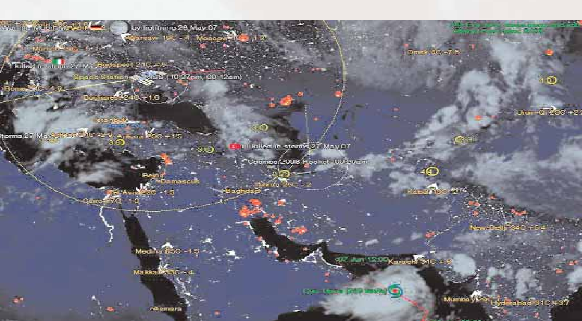
■ صورة فضائية لإعصار "جونو" في بحر العرب التقطت الساعة الثامنة وست دقائق مساء بتوقيت غرينتش الثانية عشرة وست دقائق اليوم بتوقيت السلطنة

■ سرعة دوران الإعصار قد تتجاوز أكثر من ٢٠٠ كيلومتر في الساعة واحتمالية ان يصل ارتفاع الأمواج لما يزيد عن ١٠ أمتار