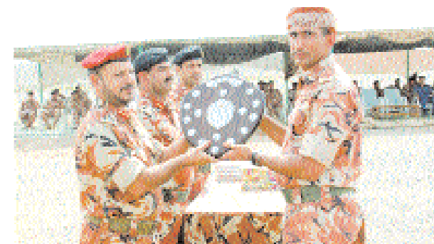
راعي الحفل خلال تكريم الفائزين

بمختلف أنواعها، وذلك تحت رعاية العميد الركن عمر بن سالم الراشدي مدير عام الادارة والقوى البشرية بقيادة الجيش السلطاني العماني. في البداية القى قائد مدرعات سلطان عمان كلمة رحب فيها بالمراسم، ودورة إسعافات أولية لعدد من ضباط الجيش السلطاني العماني والخدمات الهندسية، وذلك تحت رعاية العميد الركن عبدالله بن جميل بن سيف القريني رئيس الخدمات الطبية