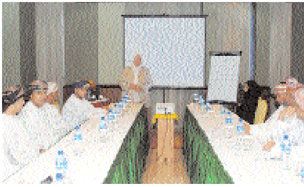
■ من حلقة العمل