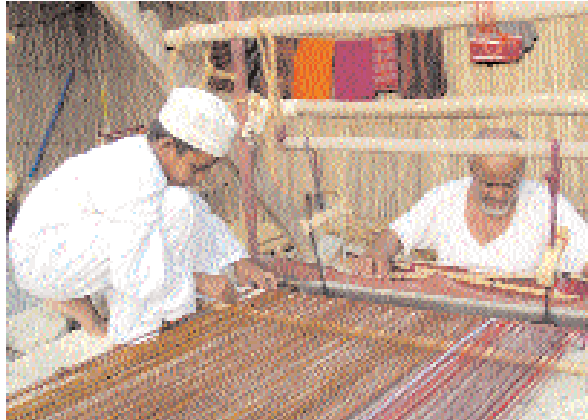
■ مسابقة التميز الحرفي تساهم في تطوير الصناعات الحرفية

ويتم خلال الندوات التعريفية فتح باب الحوار لدى الحضور والذين اثروا الندوات بتقديم عدد من التساؤلات حول المسابقة وكيفية تطوير صناعتهم الحرفية والتي شكلت تجاوباً واضحاً في العمل بتقديم الأعمال الجائزة ملكاً للهيئة والاستفادة من المسابقة بشكل أكبر. بعد منتهى إلى أن آخر موعد لاستلام الأعمال المقدمة للمنافسة يكون يوم السبت الموافق ٢٢-٢٣-٢٠٠٧ م. وحول المجالات التي يمكن للحرفي المشاركة بها في المسابقة بشكل فاعل في تطوير المنتج الحرفي أوضح العرفي بأن المسابقة تتضمن الحرف العماني ومنها الفخاريات والنسج والفخاريات والسعفيات ومن ضمنها صناعة الورق والنسج وبنوعية الصوفى والقطنى والمعادن والنحاس والنحت على العظام