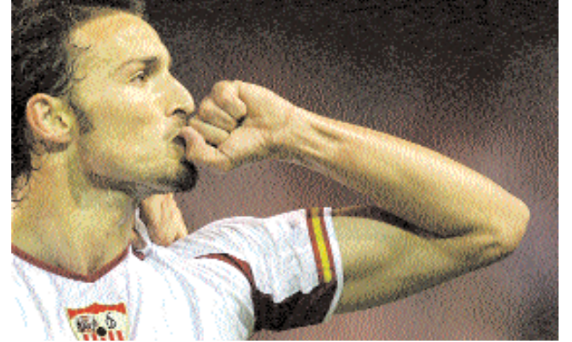
■ أنطونيو بويرتا