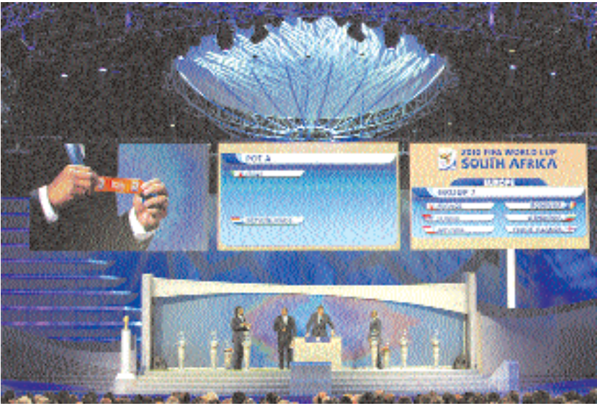
■ مراسم إجراء قرعة كأس العالم ٢٠١٠ في دوربان بجنوب أفريقيا أمس.

■ سحبت أمس في دربان بجنوب إفريقيا قرعة الدور الثالث من التصفيات الآسيوية المؤهلة لنهائيات كأس العالم لكرة القدم المقررة عام ٢٠١٠ في جنوب أفريقيا وجاءت القرعة إلى حد كبير متوازنة في المجموعات الخمس الآسيوية وسيلعب منتخبنا ضمن منافسات المجموعة الثانية التي تضم اليابان كتنصنيف اول ثم البحرين كتنصنيف ثان فمنتخبنا كتنصنيف ثالث ثم تايلاند كتنصنيف رابع وقد سبق لمنتخبنا وأن التقى مع منتخبات تلك المجموعة وهو يعرفها جيدا سواء المنتخب الياباني أحد المرشحين الأقوياء لنيل بطاقة التأهل الأولى في المجموعة الثانية وستبقى المنافسة قوية بين منتخبنا وكل من البحرين وتايلاند للفوز بالبطاقة الثانية وإلى حد كبير تبدو حظوظ منتخبنا جيدة في بلوغ الجولة الأخيرة من تصفيات الترشح إلى نهائيات المونديال ويشارك في الدور الثالث ٢٠ منتخبا وزعوا على خمس مجموعات وضعت استراليا وكوريا الجنوبية وايران والسعودية واليابان على رأس كل واحدة منها وضمت كل مجموعة أربعة منتخبات سيتأهل الاول والثاني فقط إلى الدور الرابع والنهائي الذي سيعم عشرة منتخبات وفي الدور النهائي، ستوزع المنتخبات العشرة على مجموعتين بواقع خمسة منتخبات في كل واحدة، ويتأهل الأول والثاني من كل مجموعة إلى النهائيات في جنوب إفريقيا مباشرة ويلتقي صاحبها المركزين الثالث نهابا وايبايا لتحديد المتأهل منهما لخوض الملحق مع بطل أوقيانيا. ■