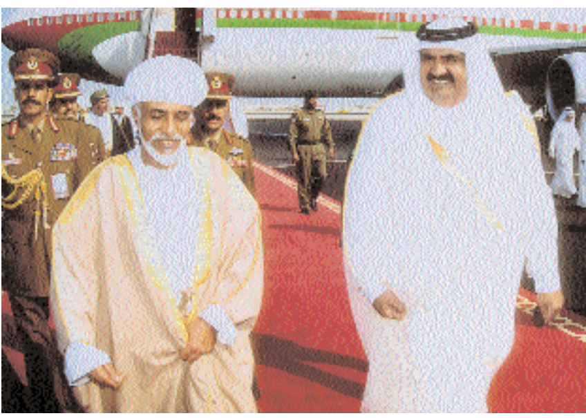
جلالته لدى وصوله الدوحة أمس وفي مقدمة مستقبله حمد بن خليفة

رسالة الدوحة - من مصطفى المعمرى وخالد العامري والعمانية