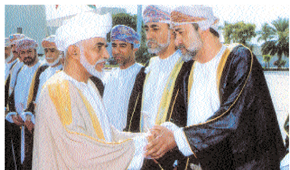
وصافح بنم بن طارق