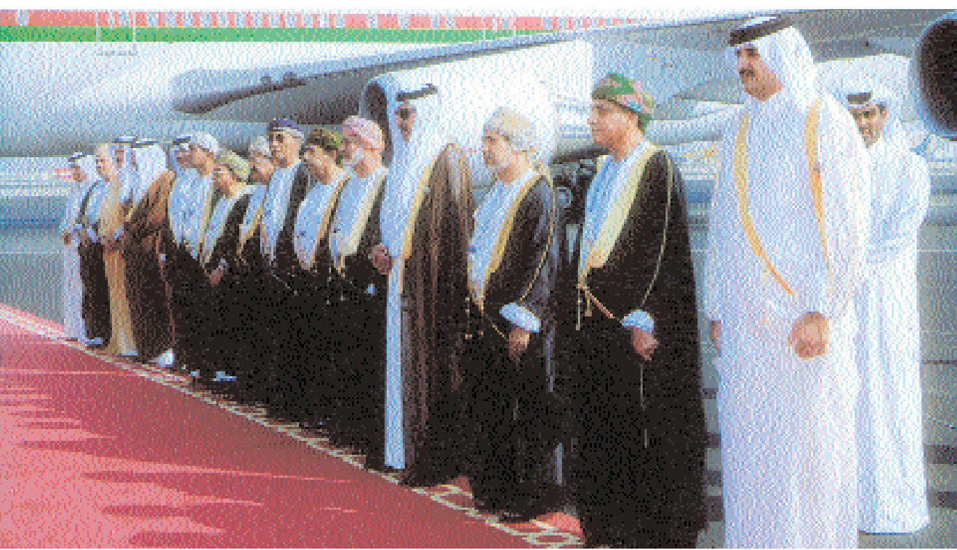
أعضاء الوفد المرافق لجلالته وكبار مستقبله ببطان الدوحة أمس