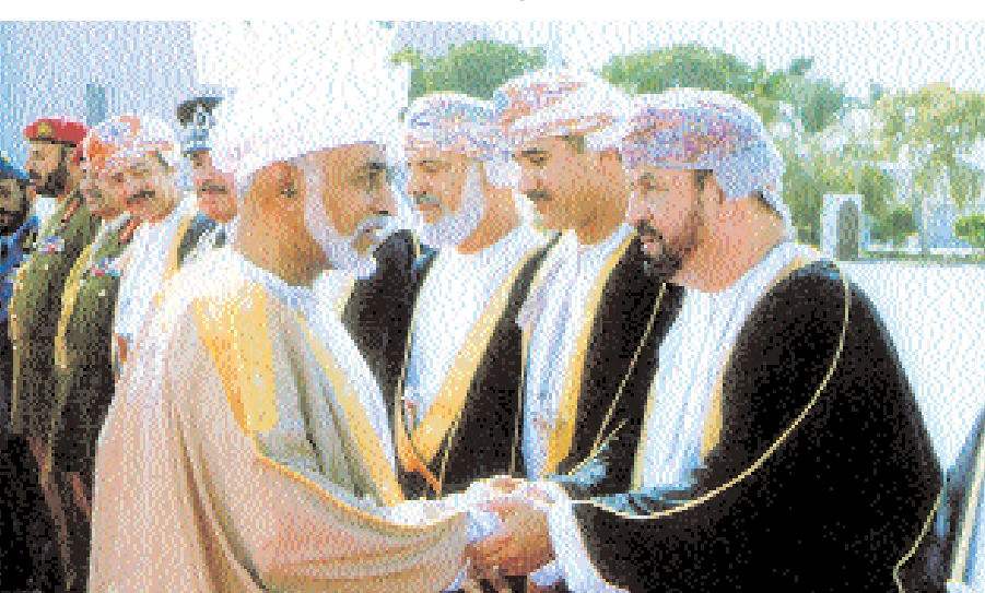
وصافح بدر بن سعود