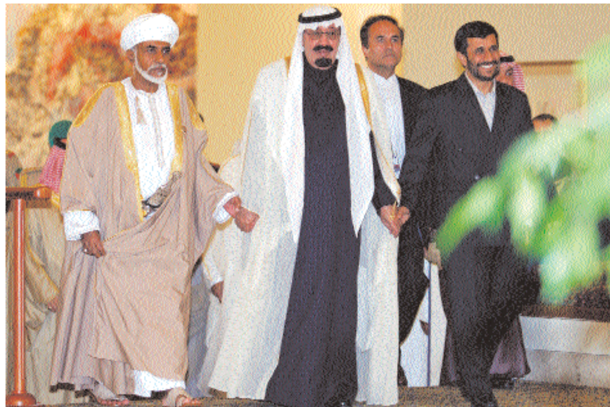
جلالته والعمال السعودي والبريتس الإيراني لدى توجههم إلى قاعة الاجتماع أمس