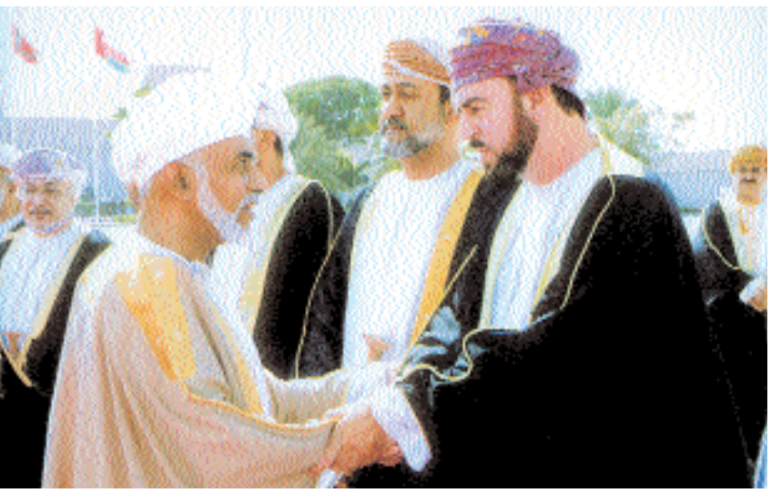
وصافح أسعد بن طارق