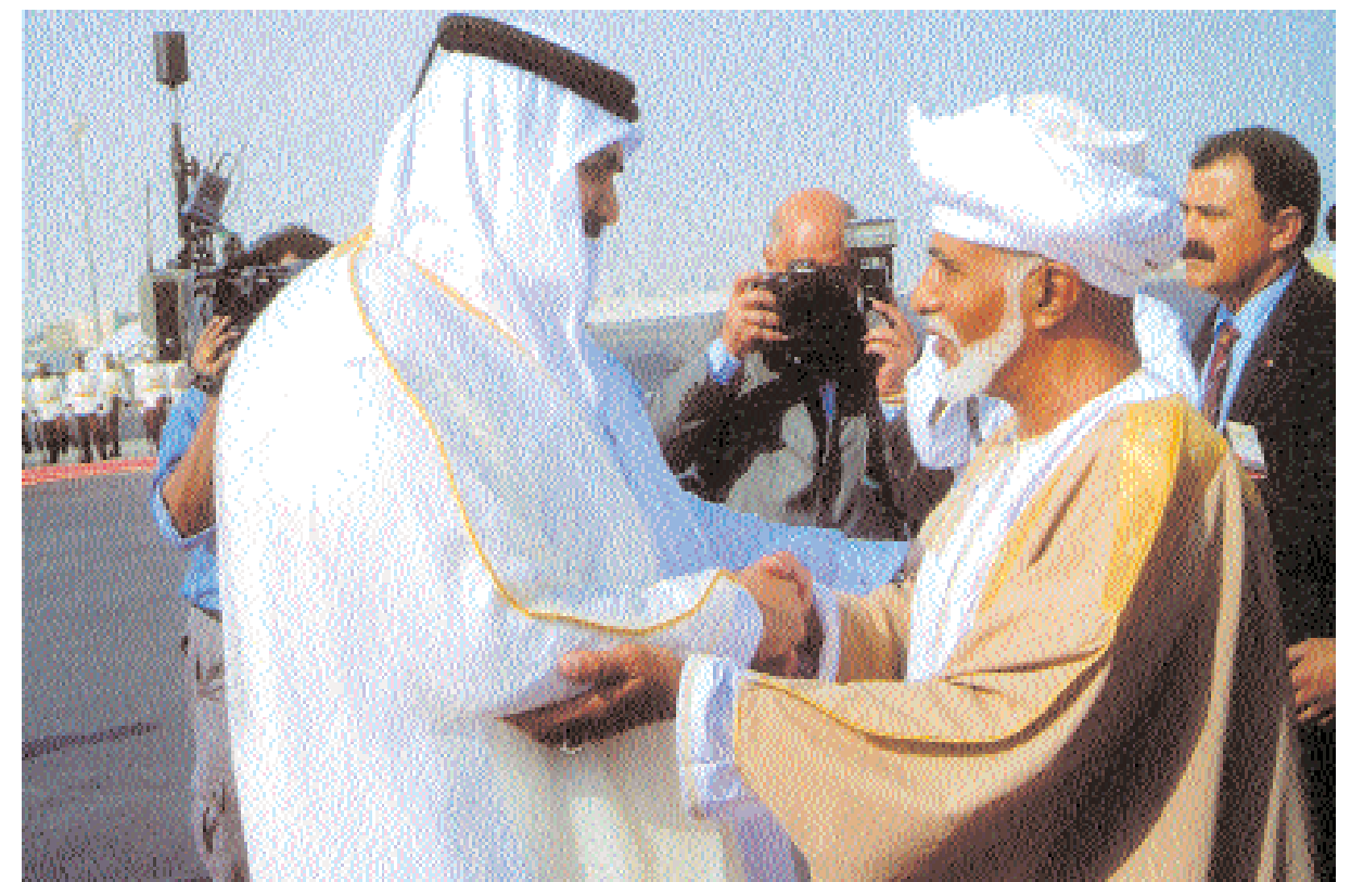
حمد بن خليفة يرحب بجلالته لدى وصوله الدوحة أمس