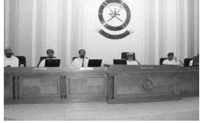
■ العيساني وعضءاء المجلس المشاركون في الندوة خلال اختتام اعمالها امس

العلوم السياسية بجامعة القاهرة تطرق فيها إلى وسائل تفعيل العضوية ودور الأعضاء في خدمة مجتمعاتهم المحلية وتنظيم علاقاتهم بالأجهزة الحكومية، مشيراً إلى العوامل المؤثرة في مدى فاعلية المؤسسة البرلمانية وغير ذلك من المحاور المتعلقة بتطوير الأداء والفعالية والنظرة للعمل البرلماني بشكل عام. وأعقب الإلقاء ورقتي العمل مناقشات