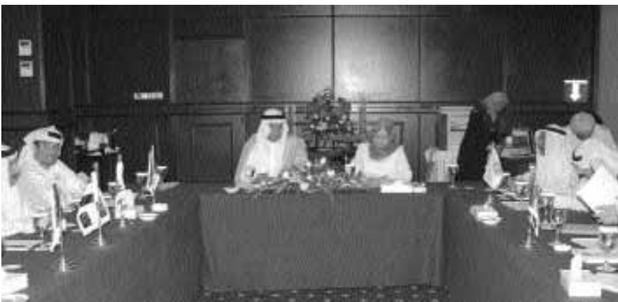
■ المشاركون في الندوة

عقب ذلك تطرق إلى التعريف بالمسابقة مشيراً إلى أن مسابقة التصميم تفتح المجال أمام طلاب الشهادة العامة في مدارس الدول المشاركة في المسابقة للابتكار في الأفكار والتميز عبر التعبير عن آرائهم في المجالات المختارة لكل عام حيث يتحور مجال هذا العام حول (التعبير عن أفضل صيغة للنجاح) وما تمثله وسائل النجاح. وأشار مدير التسويق إلى أن المسابقة تتيح المجال للفائزين النهائيين للحصول على منحة الشيخة موزة بنت ناصر المسند للإبداع والتي تخولهم للدراسة في جامعة فرجينيا كومولث - كلية فنون التصميم في قطر، كما يحصل الفائزون الثلاثة الأوائل من كل دولة من الدول المشاركة في المسابقة على جوائز مالية حيث يحصل الأول على ألف ومائتي دولار والثاني على ثمانمائة دولار والثالث على ستمائة دولار. الجدير بالذكر أن الدول المشاركة في المسابقة بلغت هذا العام ثلاث عشرة دولة بعد دخول فلسطين واليمن معها كإضافة جديدة إلى الدول المشاركة في المسابقة من قبل والتي من بينها السلطنة. ■