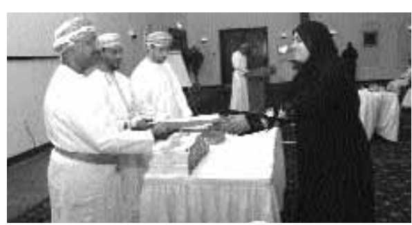
■ راعي الحفل يكرم مجموعات دعم صحة المجتمع

بيئية، دورية الدراسة لقياس مستويات التغير في المؤشرات كل خمس سنوات، ضرورة إدراج مؤشرات صحة البيئة التي تم دراستها في برنامج المدن والقرى الصحية، الحاجة لاستخدام نظام المعلومات الجغرافية (GIS) لتحديد ومعرفة التوزيع الجغرافي للمخاطر البيئية والربط بين البيانات الصحية وبيانات التعرض البيئي واستخدامات الأراضي للتنبؤ بالمشاكل الصحية الناتجة عن التخطيط. يعد ذلك قام سعاداته بتكريم مجموعات دعم صحة المجتمع المشاركة في الدراسة. يذكر أن اختيار السلطنة لتطبيق دراسة العوامل البيئية المؤثرة على صحة الأطفال في عام ٢٠٠٤ جاء لوجود نظام صحي متطور في السلطنة أشادت به المنظمات العالمية، ولوجود فريق مؤهل للقيام بهذه الدراسة. ■