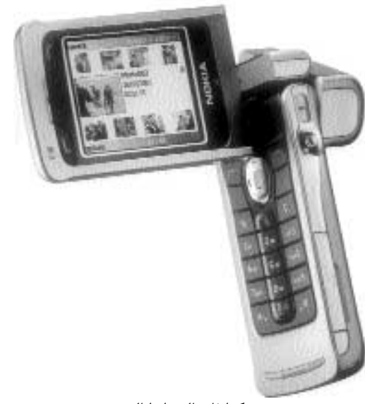
نوكيا ذات الوسائط المتعددة

وجهاز Nokia N90 الذي تم اطلاقه في أبريل هو جزء من مجموعة Nseries من هواتف الوسائط المتعددة ذات الاداء المتفوق، وهو الجهاز الاول الذي يعول على بصريات كارل زايس بالإضافة الى تشكيلة واسعة من مميزات التصوير، وما من شك ان جهاز Nokia N90 سيلبي - لا بل سيتفوق - على توقعات أكثر عشاق التصوير طلبا.