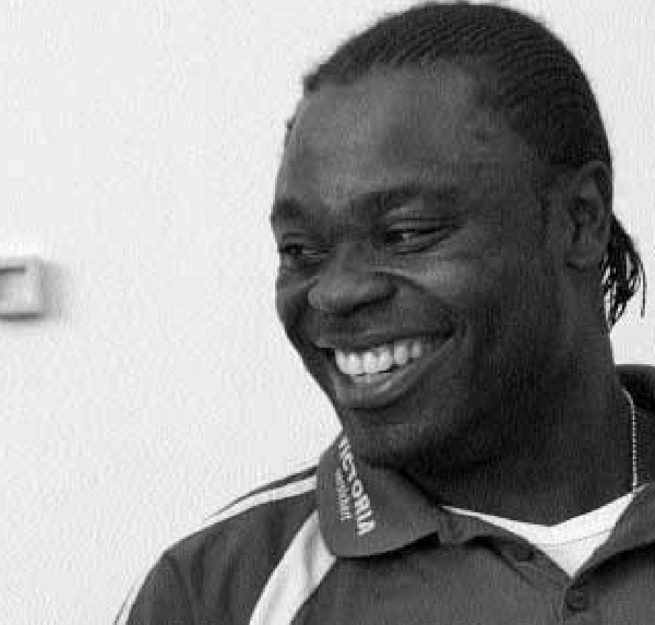
■ ميركو سلومكا، مدرب فريق شالكة لكرة القدم (يسار) يتسلم لمهاجم فريقه جيرالد اسامواه خلال مؤتمر صحفي بمدينة أشبيلية يوم ٢٦ ابريل الماضي. وقد ذكرت جريدة بيلد الرياضية امس ان غرفة ملابس فريق شالكة قد تضررت بشكل كبير بسبب شجار وقع بين أسامواه ومدربه، وهو ما تسبب في حدوث انقسام واضح في الفريق حيث انقسم اللاعبون ما بين مؤيد ومعارض لقرار المدرب سلومكا باستبعاد اسامواه من قائمة الفريق في مباراة هيرتا برلين المقبلة