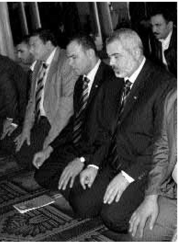
رئيس الوزراء الفلسطيني اسماعيل هنية يؤدي الصلاة في الجامع الأزهر بالقاهرة أمس.

كشفت صحيفة "هآرتس"، النقاب عن مذكرة توصيات اقترحتها الحكومة الإسرائيلية، لتمديد صلاحية "قانون الفلسطينية" العنصري، الذي يمنع جمع شمل العائلات الفلسطينية في أراضي ال٤٨، مع فلسطينيي الضفة الغربية وقطاع غزة. وأوضحت الصحفية، أن الحكومة الإسرائيلية تنوي توسيع نطاق القانون، ليشمل عدة دول أخرى، تعتبرها "ذات طابع خطير"، وتنوي كذلك إضافة المزيد من القيود الصارمة على الرعايين في الدخول إلى إسرائيل. وأشارت الصحفية، إلى أن القانون الجديد، يمنح إسرائيل الصلاحيه برفض منح الرعايين في الوصول إلى إسرائيل، بتصاريح دخول، حتى لو كانوا يخضعون للمعايير القانونية، وذلك إذا كانوا قادمين من دول أو أماكن، تجري فيها نشاطات تشكل خطراً على أمن إسرائيل أو فلسطينيها، على حد نص القانون. وأضافت الصحفية، أن لجنة الداخلية التابعة