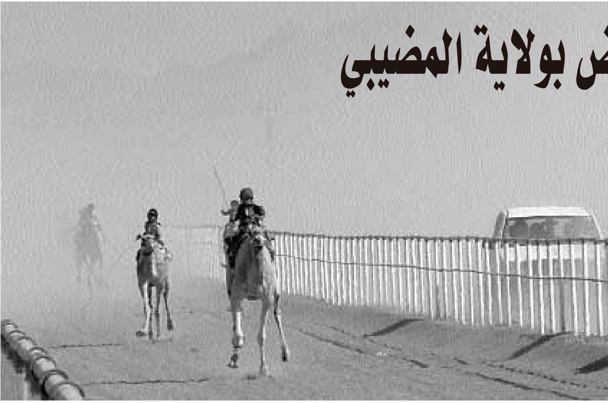
من منافسات السباق

وضع الاتحاد العماني لسباقات الهجن عدداً من القوانين لتنظيم هذه السباقات التي يجب على المتسابقين الالتزام بها ومن ضمن هذه القوانين الالتزام بالسن الذي حدده الاتحاد العماني وهو سن الرابعة عشرة للركبي وكذلك يمنع استخدام الراكب الالي وتسجيل الناقة المراد المشاركة بها بالسباق وإخذ البيانات الخاصة قبل السباق إلى جانب عدد من هذه الشروط التي تهدف إلى اظهار سباقات الهجن على قدر عالٍ من التنظيم.