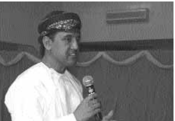
■ المحاضر يلقي محاضراته

صافي الأرباح . وفي الختام تم الرد على جميع تساؤلات واستفسارات الحضور حول كل ما يتعلق بالشركة العمانية للغاز الطبيعي المسال والدور الذي تقوم به تجاه أفراد المجتمع المحلي وعن برامج الاستثمار الاجتماعي التابعة للشركة .