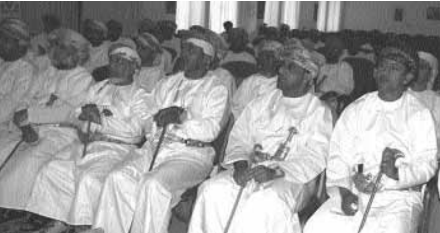
■ الحضور خلال فعاليات الندوة