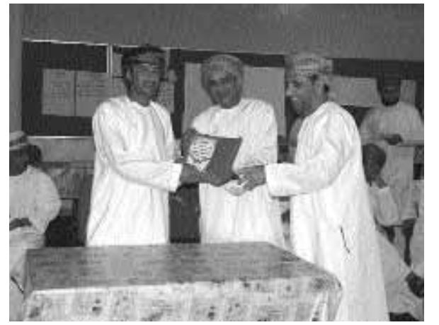
■ راعي الحفل يكرم المشاركين والمشاركات في حلقة العمل