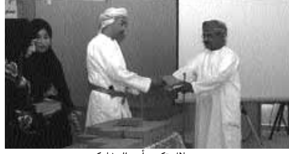
■ خلال تكريم أحد المشاركين