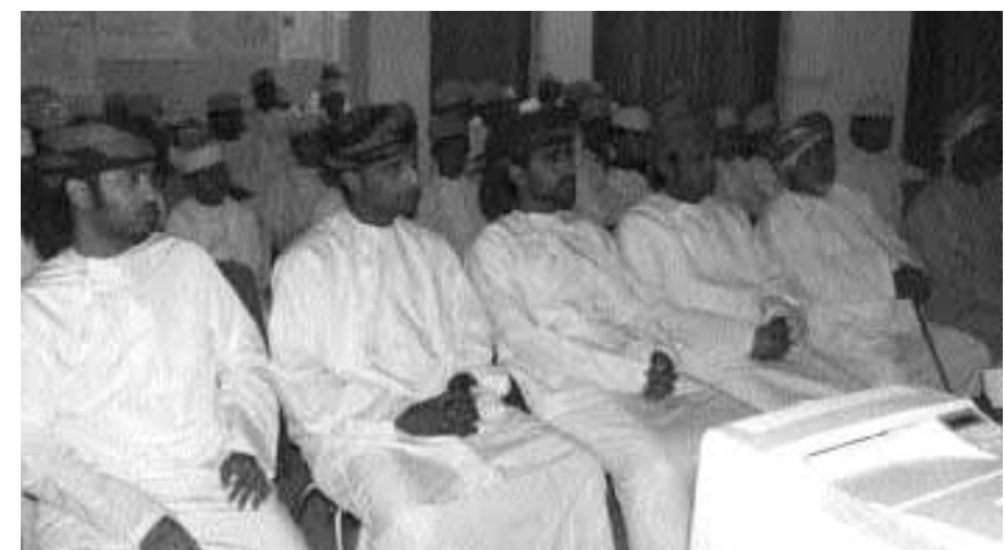
■ الحضور خلال المحاضرة

نظمت جماعة الأمن والسلامة بمدرسة جابر بن حيان للتعليم الأساسي (٥-١٢) بثمرت مؤخرًا محاضرة عن الأمن والسلامة المرورية ألقاها النقيب/ سعيد البريكي من وحدة شرطة ثمرت بحضور أولياء الأمور وبعض المدعوين ورئيس مجلس الآباء والمعلمين والطلاب، وتحدث النقيب سعيد البريكي عن أسس الأمن والسلامة المرورية والجهود المبذولة للحد من الحوادث المرورية وأوجه التعاون بين الإدارة العامة للمرور ووزارة التربية والتعليم .