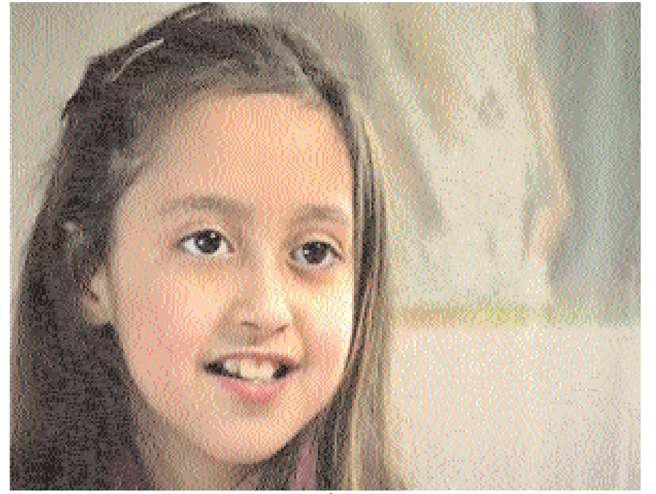
لقطة من "أطفال المهجر"