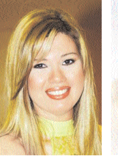
رانيا فريد شوقي