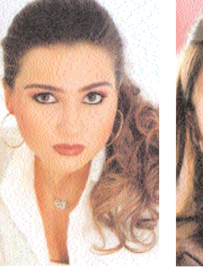
منى عز الدين