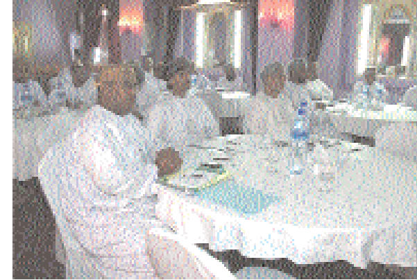
المشرفون المرشحون المشاركون في البرنامج الاطلاعي

شمولها بالبعد على عائق الجهاز الميداني. كما تضمن البرنامج تقديم العديد من العروض البحثية للمشاركين التي تعكس مدى استيعابهم للموضوعات التي تطرقت لها البرامج الإطلاعية السابقة. الجدير بالذكر أن البرنامج الإطلاعي السادس سينطلق الخميس القادم ضمن السلسلة من البرامج الإطلاعية التي تنفذها إدارة التعداد للمشرفين المرشحين من مختلف الجهات الحكومية بهدف تهيئتهم لتولي المهام المناطة بهم في الميدان.