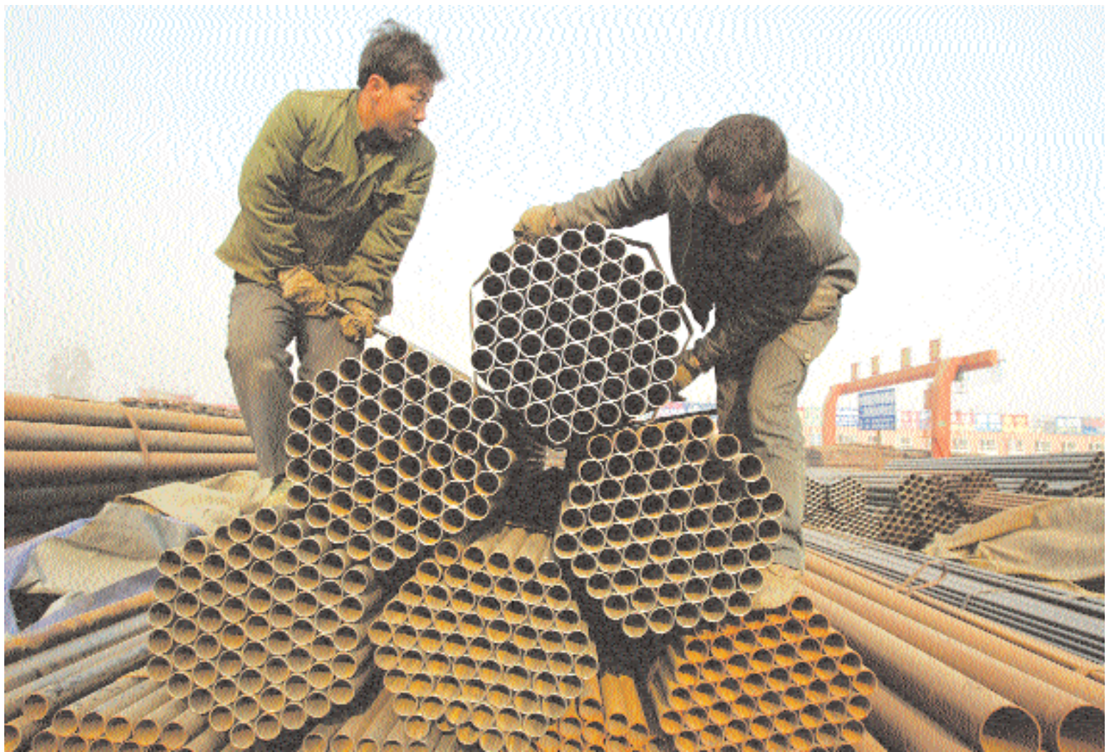
عمال يستعدون لنقل أنابيب صلب بأحد أسواق الحديد في مقاطعة شانكسي امس. وقد استنكرت الصين أمس قراراً امريكياً بغرض جمارك 16.10% على الأنابيب الصلبة المصنوعة في الصين وتعد تلك اكبر خطوة من نوعها ضد الصين التي قالت انها استخدمت كبئس فداء لمصالح دعاة حماية المنتجات الوطنية رينيز

وتطرق البرنامج أيضا إلى موضوع التعريفات والمفاهيم والمصطلحات المستخدمة في التعداد حيث تطرق هذا الموضوع إلى العديد من المفاهيم كمفهوم المسمى السكاني والمبنى التعدادي والسكن ونوع السكن هذا إلى جانب المصطلحات الأخرى كالمصدر الرئيسي للمياه ونوع حيازة الأسرة للسكن، والسكن العام. أما موضوع مسار بيانات العد الفعلي تناول الاستمارة الالكترونية المخزنة في الجهاز الكفني حيث يساعد العداد في إنجاز العمل بطريقة سهلة وسريعة وإتقان وذلك عن طريق تزويد النظام بقواعد تدقيق آلية