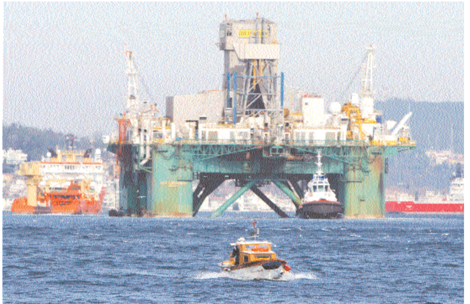
قارب صيد يمر امام منصة تنقيب عن النفط عبر البسفور في اسطنبول امس. وتعد المنصة واحدة من اكبر الحفارات في العالم حيث تمر بمضيف البسفور في طريقها الى البحر الاسود حيث تنفذ تركيا والبرازيل اعمال تنقيب مشتركة عن النفط بعد اتفاقية تم توقيعها في ابريل.

لندن - رويترز: ارتفع سعر النفط مقتربا من ٨٠ دولارا للبرميل أمس ليوصل صعوده للجلسة السابعة على التوالي ويقترب من تحقيق أكبر مكاسب في عام منذ عشر سنوات مدعوما بانخفاض مخزونات الخام والوقود الأمريكية حيث عززت برودة الطقس الطلب على الخام. وأظهرت بيانات لإدارة معلومات الطاقة الأمريكية تراجع مخزونات النفط الخام الأسبوع الماضي كما سجلت مخزونات البنزين انخفاضا مفاجئا مما دعم التوقعات بانتعاش الطلب في أكبر مستهلك للطاقة في العالم. وبلغ سعر عقود النفط الخام الأمريكي الخفيف لتسليم فبراير ٧٩,٩٠ دولارا للبرميل