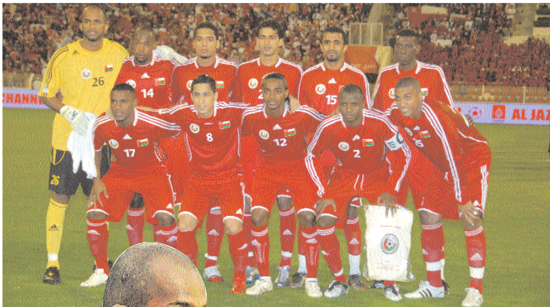
■ منتخبنا الوطني

تعني جاهزته التامة للمشاركة مع منتخبنا في لقاء الأربعا الحاسم أمام إندونيسيا ، فيما سيكون عدمها (المشاركة) حرمان الأحرر من خدماته في اللقاء ... دعواتكم ■.