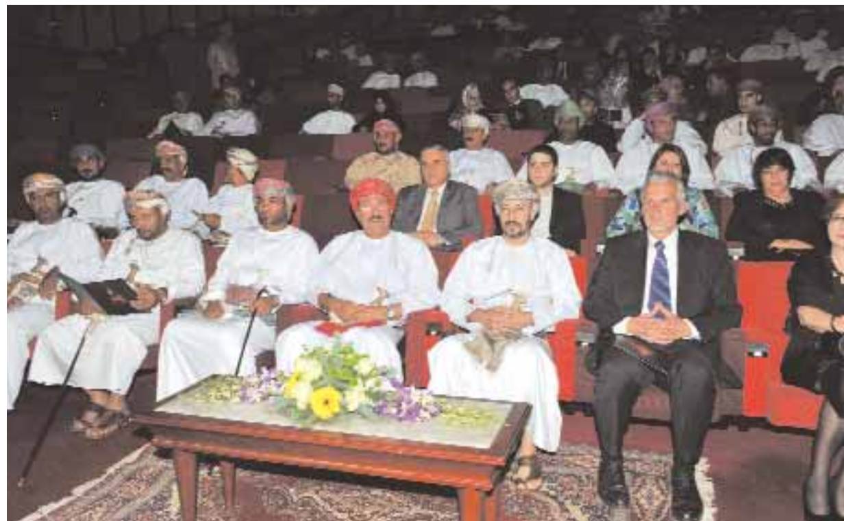
■ راعي الحفل والحضور يستمعون لفعاليات «شدو المقام»

والفعاليات الرئيسية والتي تحرص جمعية هواة العود على إقامتها بشكل سنوي كختام لفعاليتها ومناشطها على مدار العام، ومن خلال هذه الفعاليات تسعى الجمعية إلى إبراز المواهب والقدرة الفنية والإبداعية لأعضائها، خاصة جمعية هواة العود تحرص على تنظيم مثل هذه الفعاليات والأنشطة لتعود الأضواء على أجواء مثل هذه الفعاليات وعرض الأعمال الموسيقية أمام الجمهور، وأيضاً لإكساب أعضائها من هواة العود المهارات والتعلم والتأسيس السليم في العزف على آلة العود، وزيادة الإبداع الأساسية في الموسيقى العزف، وأيضاً تنقيف أعضائها فنياً وتأهيلهم أكاديمياً من أجل تطوير مهاراتهم في العزف الصحيح والمتقن على آلة العود، في سعي من الجمعية لنشر ثقافة الموسيقى الآلية وفكر الموسيقى الجادة المعبرة عن حس الفنان الراقي وإبداعاته من خلال عطاءاته الموسيقية، وحركة أنامله على آلة العود بحيث تظل دائماً هذه الآلة هي الصديق الأقرب إلى الموسيقى الشرقية والمتذوق العربي، فكل مقطوعة موسيقية يولفها ويقدمها عازف العود هي نقل لمشاعر ووجدان واحساس هذا الإنسان بطبيعته وأسلوبه سواء من خلال الغناء أو العزف أو التأليف والتلحين الموسيقي. ■