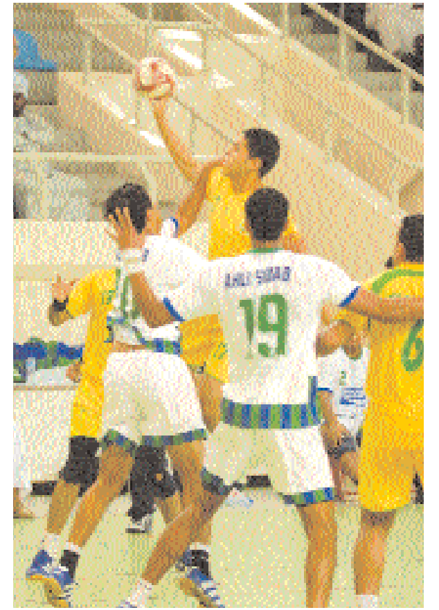
■ من لقاء السيب مع أهلي سداب