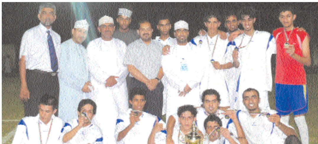
■ فريق الهندسة الميكانيكية (C) بطلا لكأس كلية كالدونيان عقب التتويج