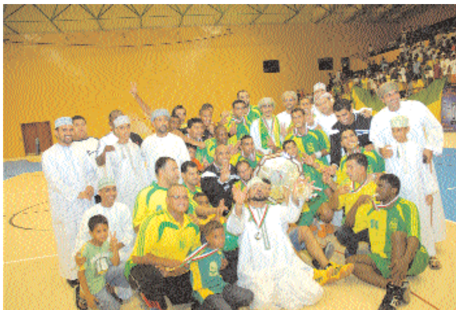
فريق السيب بطل دوري كرة اليد ٢٠٠٨