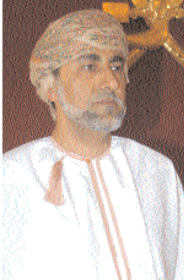
شهاب بن طارق