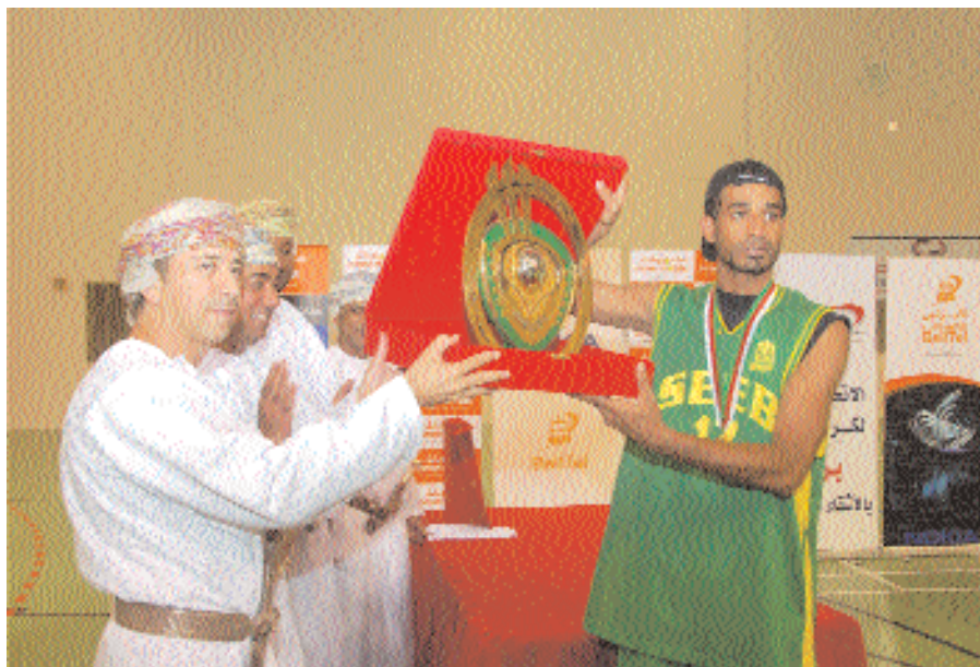
تتويج السيب بدرع دوري السلة ٢٠٠٨

وفي منافسات وبطولات العباب القوى حقق شباب النادي المركز الأول على مستوى مسقط (١٩٨٧، ١٩٨٨، ٢٠٠٧/٢٠٠٦، ٢٠٠٧/٢٠٠٦) كما حققوا المركز الوصيف على مستوى اندية السلطنة موسم (١٩٨٦ / ١٩٩٦). (المصدر: موقع النادي على الانترنت).