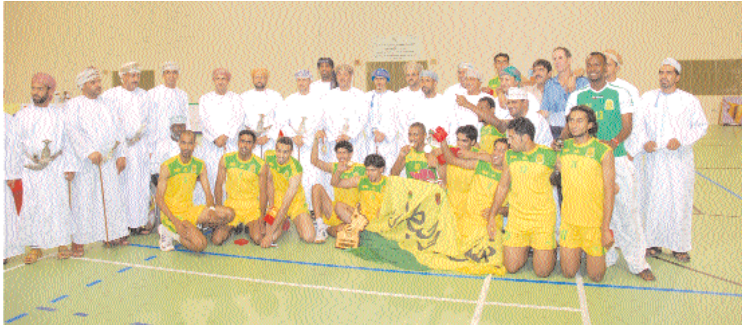
فريق السيب بطل دوري الطائرة ٢٠٠٨