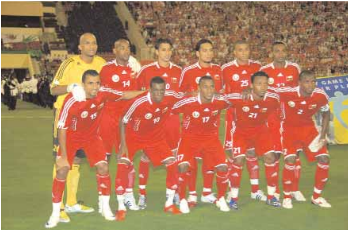
■ منتخبنا الوطني

المتوقع ألا يلتحق بتدريبات اليوم بشكل أو بآخر ، نظرا لتأخر موعد الوصول مقارنة بموعد بدء تدريبات الأحمر في هذا اليوم .