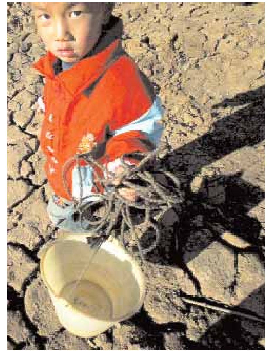
طفل صيني يحمل دلو فارغاً حيث لم يجد مياهها بعد ان نضبت في خزان بضواحي كومينج جنوب غرب مقاطعة يونان الصينية أمس الاول. وقد حذر مسؤولون مؤخرًا من ان ٢٤٠ ألف شخص يعانون من نقص المياه في منطقة جبلية جنوب الصين تعاني الجفاف منذ ٥ اشهر.

عاد مؤشر سوق مسقط للارتفاع المالي ارتفاعه من جديد وارتفع في ختام تعاملات جلسة يوم أمس بنحو ١٩ نقطة ليغلق عند مستوى ٦٥٠١ نقطة الذي تخلي عنه في وقت سابق. ولقي مؤشر مسقط (٣٠) وهو المؤشر الرئيسي دعماً محدوداً من جميع القطاعات حيث ارتفع مؤشر البنوك والاستثمار ٤٥ نقطة ليغلق عند ٩٣٩٨ نقطة وكسب مؤشر القطاع الصناعي حوالي ٢٤ نقطة ليسجل مستوى ٧١٩٨ نقطة وارتفع مؤشر الخدمات والتأمين الي ٢٥٩٤ نقطة مرتفعاً ٣ نقاط فقط.