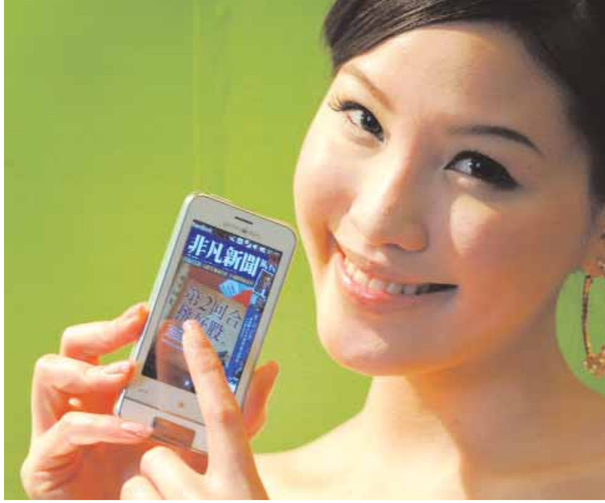
عارضة تعرض هاتفاً ذكياً جديداً طراز (جارمين. أسوس) خلال مؤتمر صحفي في تايبيه بتايوان امس. ويبلغ سعر الهاتف الذكي ٤٣٥ دولارا

بروكسل - د.ب.أ. أعلنت المفوضية الأوروبية أن مسؤولي مكافحة الاحتكار وحماية حرية المنافسة في الاتحاد الأوروبي داهموا مكاتب شركات تعمل في صناعة الإلكترونيات للاشتباه في اتفاقها على التحكم في الأسعار. وأكدت شركتا سيمسن الألمانية وأيه.بي.بي السويدية نياً المداهمة. وقال بيان صادر عن المفوضية الأوروبية إنها تستطيع تأكيد قيام مسؤوليها يوم ٢٠ يناير الماضي بمداهمة شركات تعمل في إنتاج أنظمة محولات التيار المترن. وأضاف البيان أن المفوضية لديها ما يدفعها للاعتقاد بأن الشركات المعنية انتهكت قواعد مكافحة الاحتكار الأوروبية التي تحظر ممارسات التكتل والتحكم في السوق. ولم تحدد المفوضية أسماء الشركات التي تمت مدهمتها ولكن سيمسن وأيه.بي.بي أكدت تعرض مكاتبها للمداهمة. يذكر أن المفوضية الأوروبية هي الذراع التنفيذية للاتحاد الأوروبي والمسئولة عن مراقبة التزام الشركات بقواعد المنافسة الحرة ومكافحة الاحتكار. وفي حالة إدانة الشركات سيتم تفرغها بما يتناسب مع حجم المبيعات التي تمت خلال فترة الممارسات غير القانونية.