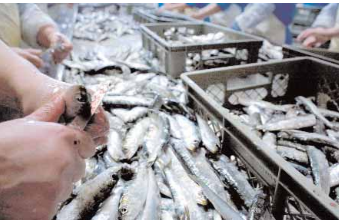
عامل ينظف اسماك السردين بعد وصولها من مركب صيد بمصنع تعليب قرب بورتو في البرتغال امس حيث اصبحت البرتغال اول بلد بالاتحاد الاوروبي يصدر شهادة استدامة لاسماك السردين التي تصطادها المراكب البرتغالية.

بنوم بنه (د ب أ) - عقد أصحاب شركات الملابس في كمبوديا محادثات مع نقابات العمال ومسؤولين حكوميين بشأن زيادة الحد الأدنى للأجور الشهرية لعمال المصانع بقيمة ٥٠ دولارا. وتوصلت نقابات العمال والمعهد الوطني للإحصاء التابع للحكومة إلى أن كل عامل في قطاع الملابس وعددهم ٣٥٨ ألف عامل بحاجة إلى ٩٣ دولارا شهريا ليتمكن من توفير مصاريف الغذاء والإسكان والتنقل. وقال رئيس رابطة مصنعي الملابس في كمبوديا وهي هيئة صناعية لصحيفة (بنوم بنه بوست) امس الثلاثاء إنه يؤيد «مبدئيا» زيادة الأجور. وأضاف فان «و أيج» (لكن) أكد أن أوكد للعمال أننا اليوم بصد المناقشة فقط وليس الموافقة على زيادة بقيمة ٩٣ دولارا موضحا أن الموضوع بحاجة لمزيد من البحث قبل التوصل لأي اتفاق.