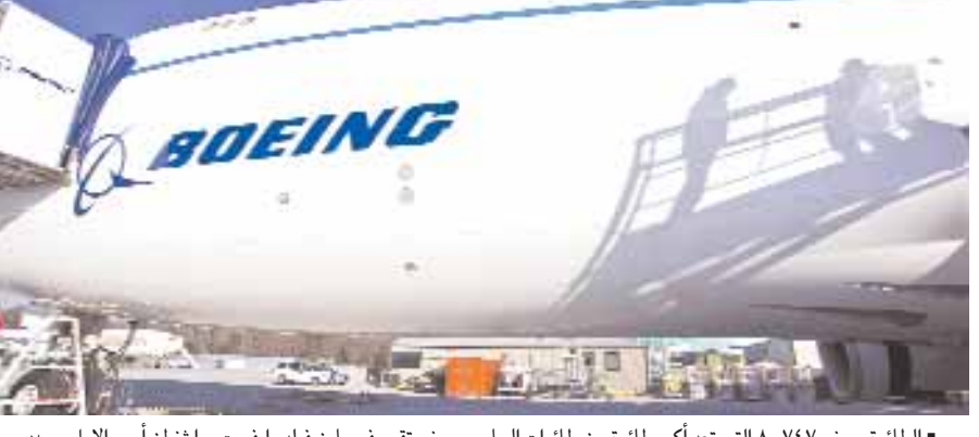
الطائرة بوينغ ٧٤٧ التي تعد أكبر طائرة من طائرات الجايبو بوينغ تقع في باين فيلد. أيفرست - واشنطن أس الأول.