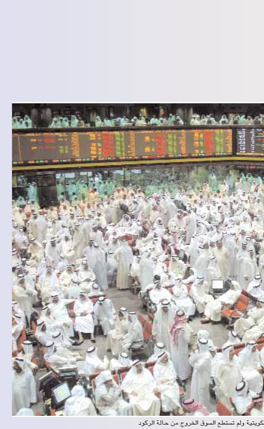
صورة أرشيفية للورصة الكويتية ولم تنشط السوق الخروج من حالة الركود

عكس اتجاهه التراجعي الذي لازمه على مدار الأسبوعين الماضيين، وانهى تداولات الأسبوع الحالي بنمو بلغت نسبته ١٣,٠٧ في المائة، وصلا إلى سعر ٠,٥٢٠ ريال عماني. نظمت عمليات التداول في السوق مساهمة الشركات للاتصالات ارتفاعا نسبته ٤,٤٧ في المائة وأقلقت عند سعر ١,٢٨٨ ريال عماني. كما تم سحب شركة جلفار الهندسية من ٠,٩٢ في المائة إلى قيمته وأقلقت عند مستوى ٦,٥٩١,٨٣ مليار.