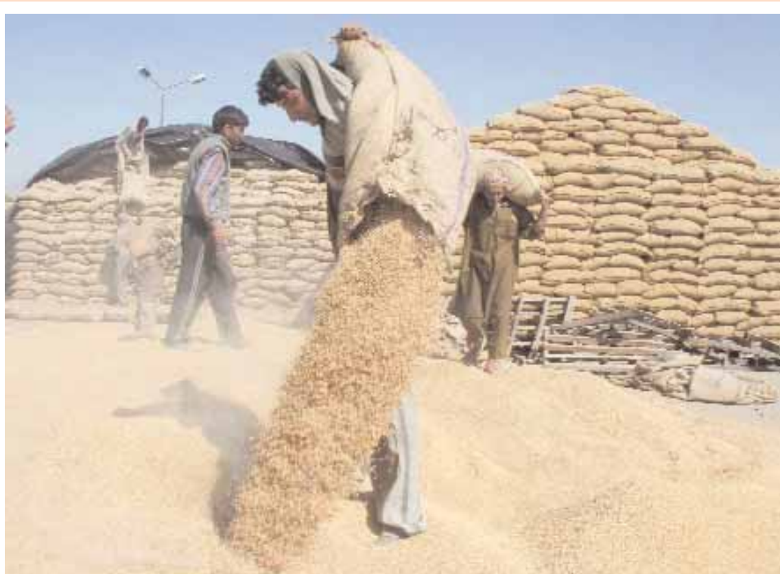
■ عامل يفرغ جولا مملوء بالارز للتجفيف في سوق اللغلال في مدينة شانديجراف شمال الهند امس حيث ذكرت الحكومة الهندية أن لديها مخزونات كافية من اللغلال مستعدة لاستيراد الأرز.

دبي - دبأ: قالت صحيفة اماراتية أمس الاثنين ان متحدثا رسميا باسم حكومة دبي، وأخر باسم مجموعة «دبي العالمية» نفيا أن تكون المجموعة قد تقدمت بأي مقترحات لتسوية ديونها حتى الآن وقال إن المفاوضات مستمرة مع الدائنين والمجموعة لم تقدم أي مقترحات بشكل مباشر. وأكد المصدر الحكومي لصحيفة الخليج أن مجموعة دبي العالمية ستعلن في نهاية الشهر المقبل التفاصيل الرسمية الكاملة لمفاوضاتها مع الدائنين والعروض المقدمة في هذا الإطار. وكانت وكالة «داو جونز» نقلت عن مصادر قولها إن دبي العالمية ستقدم في نهاية ابريل المقبل عرضين على دائنيها ضمن طلبها عادة هيكله ديونها البالغة ٢٢ مليار دولار. يتمثل العرض الأول في دفع المجموعة ٧٠٪ من ديونها على مدى ٧ سنوات مع ضمان من حكومة دبي. في حين يتمثل العرض الثاني في حصول الدائنين على كافة ديونهم من دون ضمان حكومي مع الإشارة إلى إمكان أن يتضمن العرض الأخير استبدال ديون بأصول تابعة لشركة «نخيل» التابعة للمجموعة. ونقلت الصحيفة عن مصدر قريب من الحكومة قوله إن تسريب المعلومات حول المفاوضات الدائرة حاليا بين المجموعة والدائنين لإعادة هيكله ديونها ينصب في دائرة الضغوط التي تسعى البنوك الدائنة إلى فرضها لتعزيز موقفها التفاوضي. ونقلت الصحيفة عن «فاينانشيال دايناميك» أحد المستشارين لشركة «دبي العالمية» في ملف المفاوضات مع الدائنين بأن ما تم نشره عن خطة سداد بضمان حكومي محض «شائعات» وأن الشركة مستمرة في مباحثاتها مع الدائنين تبعا للخطة الموضوعه.