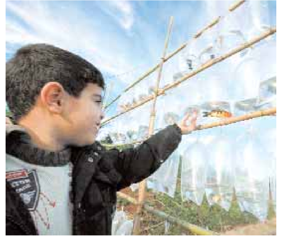
■ طفل بجوار اسماك ذهبية داخل اكياس بلاستيكية معروضة للبيع بحدود شوارع الجزائر العاصمة امس.

■ دوسلدورف - فرانكفورت (ألمانيا). د.ب.أ: تستعد شركة الطيران الألمانية لوفتهانزا لمواجهة أكبر إضراب في تاريخها من خلال إعداد خطة طوارئ. وقال المتحدث باسم لوفتهانزا اندرياس بارتليس في تصريحات لصحيفة "راينشه بوست" الألمانية الصادرة أمس الأربعاء: "نتوقع مع الأسف حدوث إضراب". ووفقاً لمعلومات صحيفة "راينشه بوست" فإن الطيارين وافقوا بأغلبية كبيرة على الإضراب. وأعلن المتحدث باسم كوكبيت عن إضراب واسع النطاق لطيار لوفتهانزا على غرار ما حدث عام ٢٠٠١ حيث أضرب الطيارون عن العمل لمدة أيام وتسببوا في حالة فوضى شديدة في المطارات الألمانية. وسيكشف اتحاد كوكبيت بشكل رسمي عن نتائج التصويت على الإضراب بين نحو ٤٥٠٠ طيار يوم الإثنين المقبل. وتتطلب الموافقة على الإضراب موافقة ٧٠٪ على الأقل. وكانت كوكبيت قد أعلنت في ديسمبر ٢٠٠٩ عن فشل مفاوضاتها مع الشركة حيث كانت تطالب بزيادة في الرواتب بنسبة ٤٪. من جهتها طالب مجلس إدارة لوفتهانزا طياري الشركة بعدم الانفعال عليها من خلال الإضراب في وقت الأزمة الاقتصادية. ■