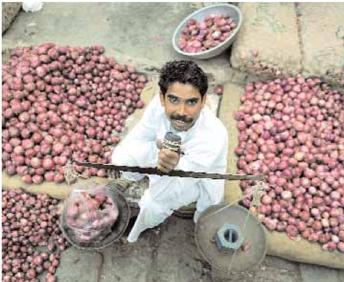
■ بائع خضراوات هندي يزن بصلا لزبائن بحدود أسواق الجملة في نيودلهي امس. وقد قفز التضخم في الهند إلى أعلى مستوى في أكثر من عام بسبب الارتفاع الكبير في أسعار المواد الغذائية مما يزيد الضغط باتجاه تقليص اجراءات التحفيز التي اطلقت انتعاشاً اقتصادياً.

■ نيودلهي - : قال وزير المالية الهندي براناب موخيرجي أمس الأربعاء إن المتوقع أن ينمو الاقتصاد الهندي بنسبة ٧.٥٪ للعام المالي الجاري المنتهي في مارس القادم وقد يتخطى نسبة ٨٪ في العام المالي القادم مدفوعاً بالتعافي الصناعي القوي. كان مؤشر الإنتاج الصناعي الذي يقيس حجم ناتج المصانع في الهند قد سجل أعلى مستوى له في ١٦ عاماً عندما بلغ ١.٦٨٪ في ديسمبر. وقال موخيرجي إن "مؤشر الإنتاج الصناعي لديسمبر عام ٢٠٠٩ يشير إلى أننا قد ننهى العام المالي ٢٠٠٩ ٢٠١٠ بمعدل نمو للإنتاج المحلي الإجمالي عند ٧.٥٪ وربما سنكون قادرين على الوصول إلى أكثر من ٨٪ في العام المالي القادم". وتبدأ السنة المالية للهند في أبريل وتنتهي بنهاية مارس. وسجل الاقتصاد نمواً بنسبة بلغت أكثر من ٩٪ على مدار ثلاث سنوات متتالية قبل أن تخسب الأزمة المالية العالمية في إبطاء النمو إلى ٦.٧٪ في العام المالي ٢٠٠٨ ٢٠٠٩. ■