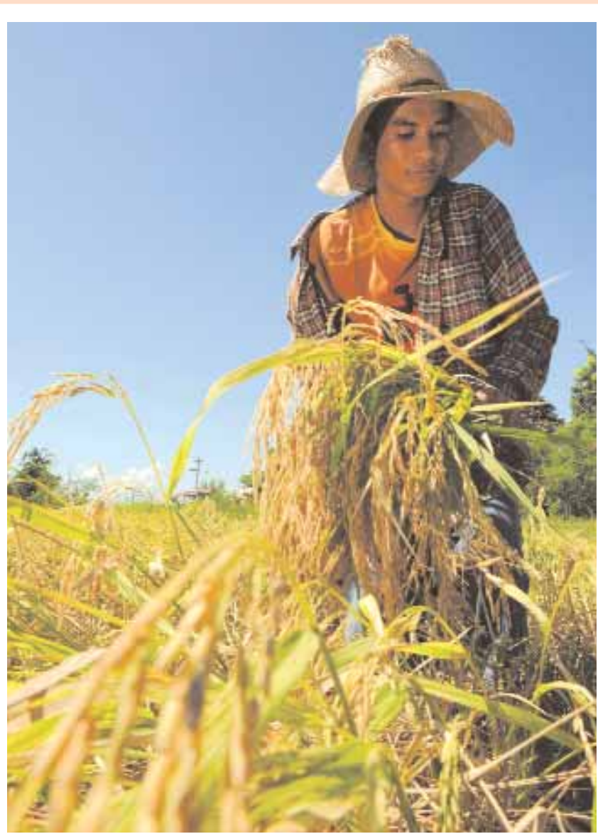
صورة ارشيفية بتاريخ 19 اكتوبر 2008 لمزارعة فلپينية تحصد محصول الارز في مقاطعة باجاسان شمال الفلبين. وقد ذكرت مصادر فلپينية امس ان قطاع الزراعة قد يخسر 423 مليون دولار هذا العام بسبب الجفاف الناتج عن ظاهرة النينو.

ونكر روبرت ستافينز مدير برنامج اقتصادات البيئة في جامعة هارفرد "لا اعتقد أن كيوتو مات".