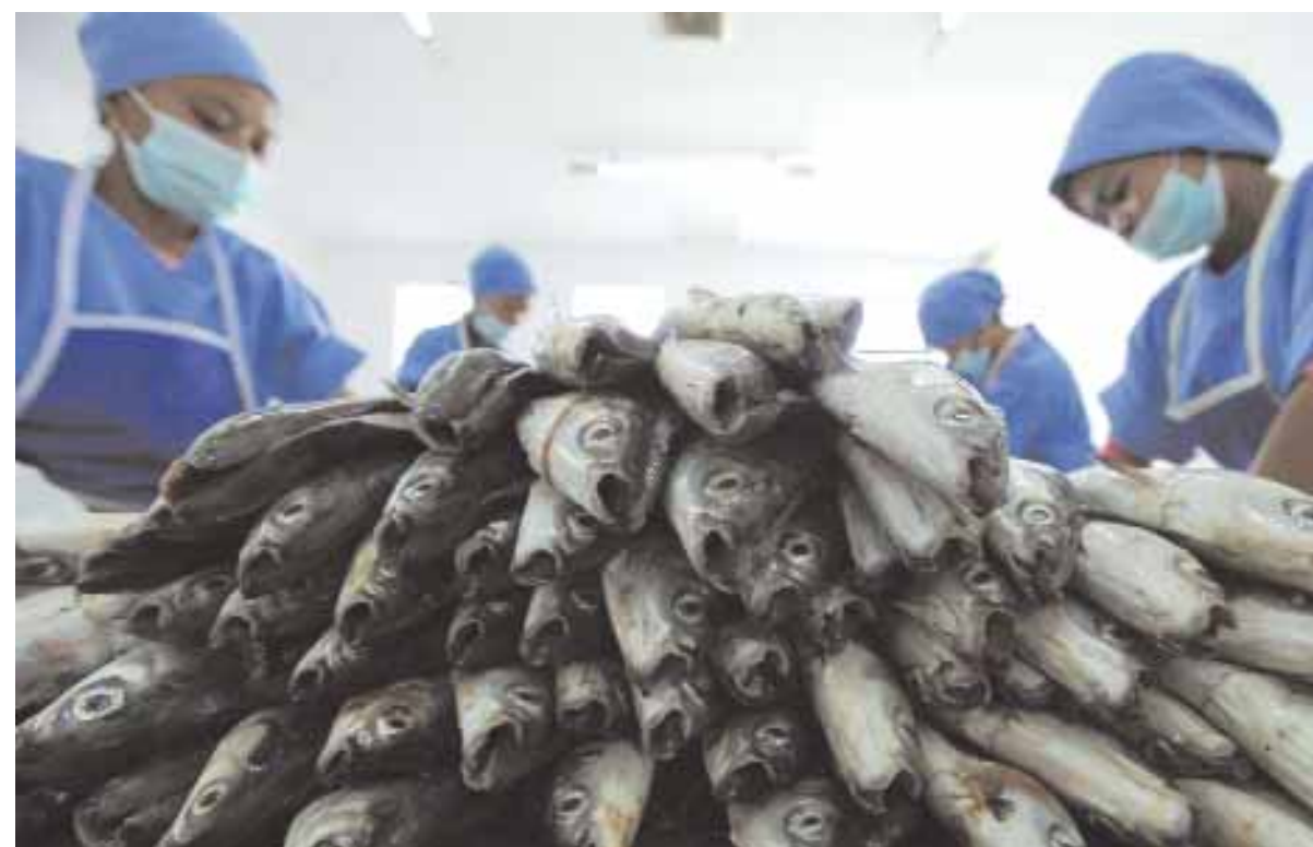
عاملات يجهزن سمك الحليب داخل مزرة لاسماك بالقرب من بولو براموكا في الالف جزيرة شمال جاكرتا امس وتغطي المزرعة مساحة 3 آلاف متر مربع وتنتج ما يربو على 400 كجم من سمك الحليب الخالي من العظم يوميا.

برلين - د.ب.أ: تسبب إضراب تحذيري نفذته العاملون في شركة «إيزي جيت» للطيران منخفض التكلفة في اضطراب جدول الرحلات بمطار برلين شونفيلد في العاصمة الألمانية صباح امس الخميس وقالت مصادر المطار إنه جرى إلغاء جميع رحلات الشركة. ودعت نقابة «فيردي» للعاملين في قطاع الخدمات إلى الإضراب التحذيري. وتطالب النقابة بمجلس عمال للعاملين بالشركة. وأخفقت سبع جولات مفاوضات في التوصل لتقارب في وجهات النظر بين الشركة والنقابة.