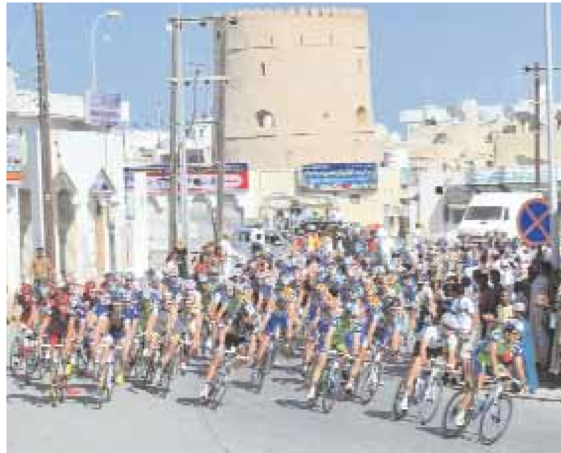
الدراجون خلال تواجدهم في سوق ولاية بركاه

قال سعادة سلطان بن حمدون الحارثي رئيس بلدية مسقط ورئيس المجلس البلدي أن طواف عمان حقق الأهداف المرجوة منه فعلى المدى البعيد ستحقق أكبر النتائج مستقبلاً أما على المدى القصير فإن نتاجه قد ظهرت بشكل كبير من خلال الصدى الرائع