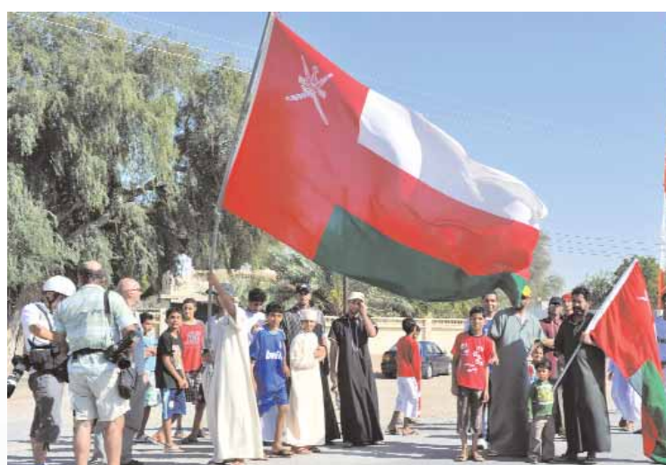
حرص جماهيري على تشجيع المتسابقين