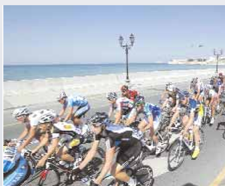
المتسابقون خلال تواجدهم بالشارع البحري في الغرم

والتميز الذي حققه من خلال تحقيق العديد من الفعاليات المتمثلة في الناحية الثقافية والتنظيمية وتجسيد عمان كبلد حضاري وعالمي قادر على استضافة العديد من الفعاليات الرياضية بنجاح كبير وبشهادة الجميع وأضاف سلطان الحارثي أن الجولة الأخيرة من طواف عمان للدراجات الهوائية ستكون الأسرع والمعانيه للدراجات الهوائية التي تقوم بالانطلاق على تنظيم السباقات والاهتمام بالمنتخب الوطني للدراجات الهوائية حيث يوجد لدينا حالياً ١١ اتحاداً تشرف على عدد من اللعابت الجماعية والفردية وتشهد إقبالاً جماهيرياً كبيراً. وأشار السندي بمبادرة بلدية مسقط في تنظيم سباق طواف عمان للدراجات الهوائية حيث استطاع هذا السباق جذب شركات القطاع الخاص في تقديم الدعم له فيما تمثل دعم الوزارة في الجانب الفني فقط.