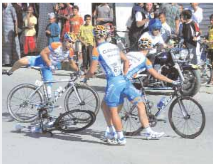
سقوط ثلاثي لفرق جبرمن في مرحلة بركاه