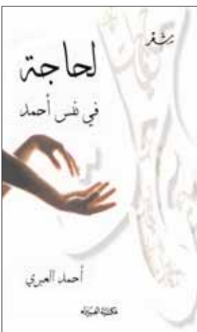
■ غلاف المجموعة