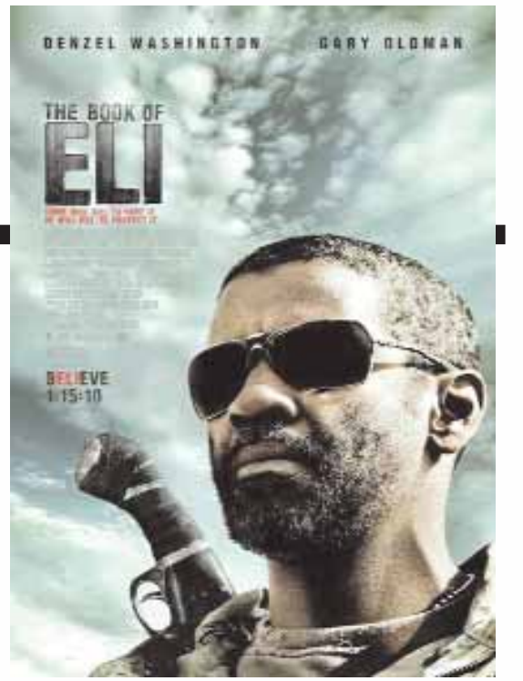
مايكل سوليفان *

الجثث التي تركها ايلي حتى لو كان هذا الكتاب يعتقد أنه هو القوة المنقذة للعالم ، هذا ما يدفعنا للتساؤل عما إذا كان هناك اختلاف حقيقي بين ايلي و كارينجي . الفيلم يتوج معركة تستحق وسام Peckinpah حيث يعرض لمعسكرين الأول معسكر الخريين والذي يمثله ايلي ، وسولارا وجورج ومارتا (مايكل جامبون وفرانسيس دي لا تاور ) و معسكر الأشرار الذي يمثله الشخص البغيض كارينجي وجيش صغير من المرتزقة مجهزة بالمدافع الرشاشة وقاذفات الصواريخ ما يكفي لتحويل مزرعة الى حطام ، والمواجهة بين الأخيار و بين الأشرار ليست هي نهاية المطاف فهناك تحولات أخرى تأتي مرضية تعوض قليلا ما حدث من الأشرار . ■