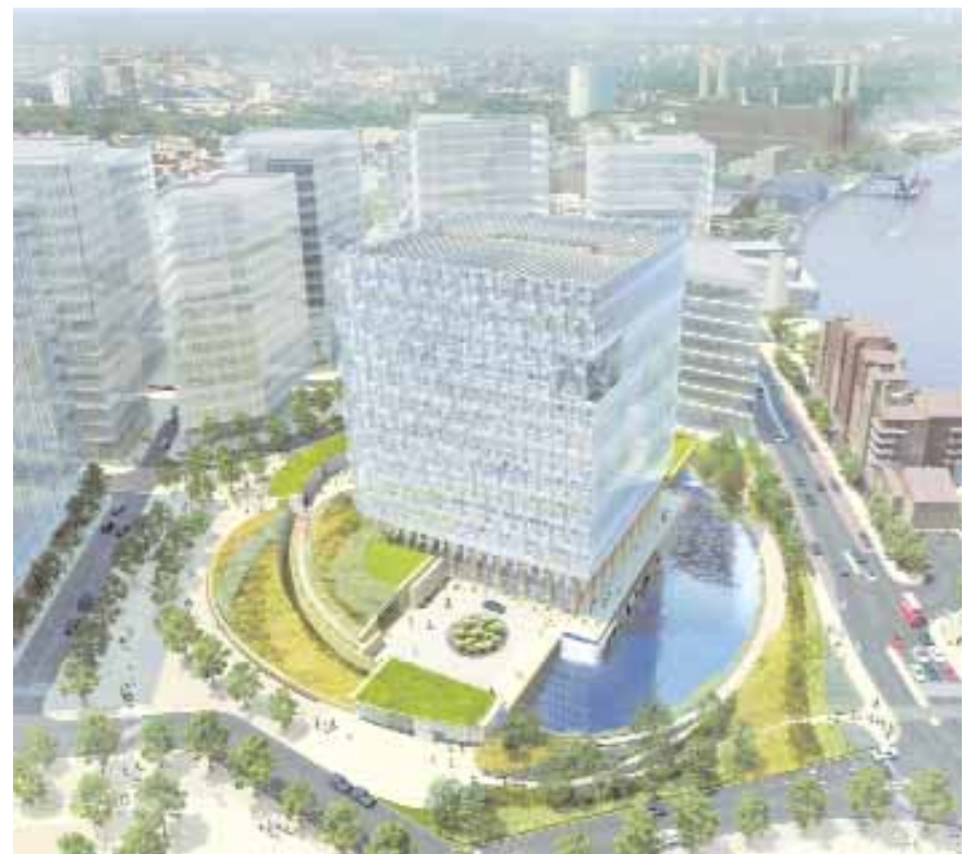
رسم تصوري بالحاسوب وزعته أمس السفارة الأميركية في لندن لسفارتها المستقبلية هناك. حيث أعلنت الولايات المتحدة أنها اختارت تصميماً من شركة (كيرانتييمبرليك) المعمارية بعد الأحدث والأكثر توفيراً للطاقة حيث يغطي المبنى طبقة رقيقة من خلايا فولتو ضوئية لاستفادة من الطاقة الشمسية.