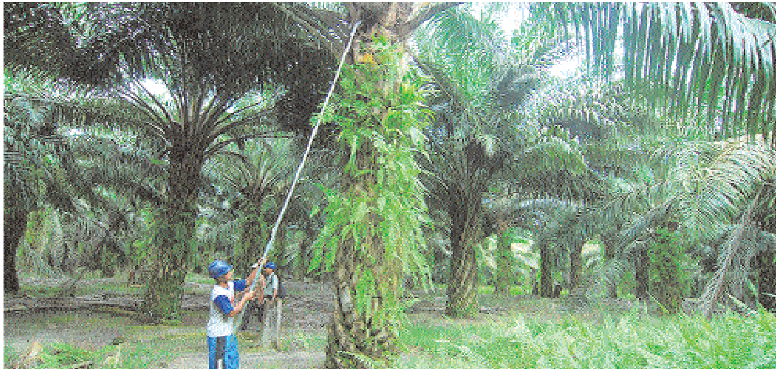
عمال يحصدون ثمار نخيل الزيت في مزرعة في بانجكالان بوسط كاليمانتان بإندونيسيا. يذكر ان بذور الزيت تعتبر نعمة كبيرة في إندونيسيا وهي اكبر منتج لزيت النخيل في صناعة تشغل ثلاثة ملايين شخص

باريس - د.ب.أ. رويترز: قالت سلطات الطيران المدني الفرنسية ان رحلات الطيران في فرنسا ستعطل ليوم ثالث امس الخميس بعدما فشلت المحادثات بين مراقبي الحركة الجوية والحكومة في إنهاء إضراب. وقالت الادارة العامة للطيران المدني في بيان انه تم إلغاء نصف الرحلات في مطار أورلي في باريس و١٥ في المئة من الرحلات في مطار شارل ديغول في العاصمة ايضا. لكن اير فرانس اكبر شركات الطيران الفرنسية قالت بموقعها على الانترنت انها ستضمن كل رحلاتها طويلة المدى من مطاري شارل ديغول وأورلي و٨٥ في المئة من رحلاتها الأوروبية والداخلية من المطارين. وقررت النقابات مواصلة الاضراب بعدما فشلت محادثات مع وزارة البيئة الفرنسية امس الاول في التوصل الى حل. ودعت النقابات الى اضراب لخمسة ايام اعتبارا من الثلاثاء الماضي احتجاجا على اتفاق لتحديث مراقبة الحركة الجوية وقته بلجيكا وفرنسا وألمانيا ولوكسمبورج وهولندا وسويسرا.