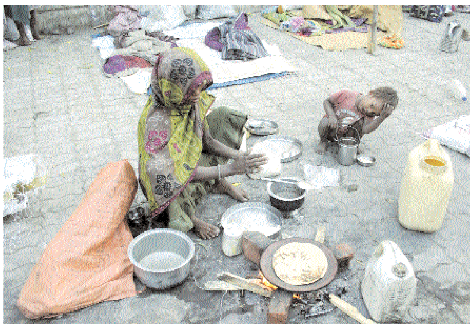
■ امرأة بلا مأوى تعد خبزاً على رصيف للمشاة، في أحد شوارع أحمد آباد، بالهند، أمس، حيث تحتاج الهند إلى مراجعة انفاقها العام وتحسين موقفها المالي، كما صرح بذلك وزير المالية الهندي براناب موكهيري أمس.