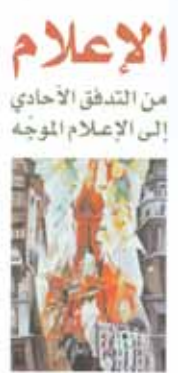
■ غلاف الكتاب

تناول موضوعات "القنوات الفضائية الموجهة نموذجاً حديث على الإعلام الموجه" وطرح أمثلة على قنوات العالم الإيرانية، والحرّة الأميركية، والبي بي سي العربية البريطانية، وقناة روسيا اليوم. تجدر الإشارة إلى أن الكتاب يتواجد في معرض مسقط الدولي الخامس عشر للكتاب في جناح دار الانتشار العربي. ■