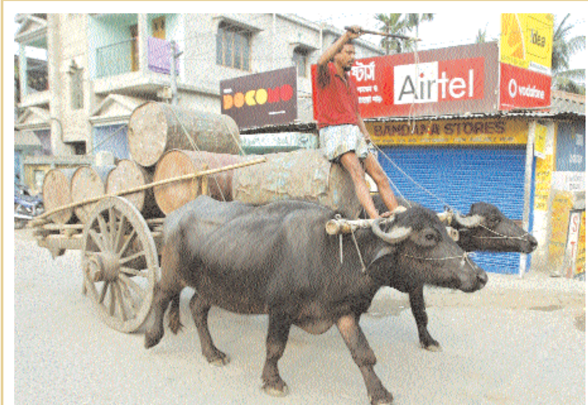
■ هندي يقود عربة يجرها ثوران محملة ببراميل نطف مارا بلافتة لشركة اتصالات هندية في سيليجوري امس حيث من المتوقع ان تعرض الهند في المزداد الجيل الثالث من شرائح الطيف اللاسلكية في اغلب مناطق الاتصالات بداية من ٩ ابريل القادم رويترز

■ طوكيو - رويترز: هبط معدل الباحثين عن عمل في اليابان في يناير وتحسنت ايضا الوظائف المتاحة مقارنة مع الشهر السابق رغم انه ما زال يوجد أقل من خمس وظائف متاحة لكل عشرة أشخاص يبحثون عن عمل. وأظهرت ارقام رسمية أمس الثلاثاء ان معدل الباحثين عن عمل تراجع إلى ٤,٩ بالمئة من ٥,٢ بالمئة في ديسمبر. وهذه هي المرة الاولى منذ مارس من العام الماضي التي يهبط فيها معدل الباحثين عن عمل في اليابان عن مستوى ٥ بالمئة. وتراجع عدد عروض الوظائف الجديدة ١,١ بالمئة في يناير مقارنة مع الشهر السابق مسجلا أول انخفاض في خمسة أشهر ومنخفضا ١٣,٤ بالمئة عن مستواه قبل عام.