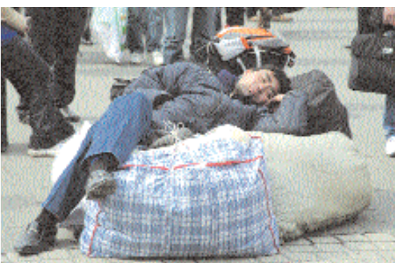
■ صيني ينام على متاعه بمحطة لسكك الحديدية بكيين امس حيث نشرت الصحف الصينية طلبا مشتركيا لاصلاح نظام تسجيل المنازل بالصين والذي يحد من وصول العمال الريفيين المهاجرين الى الخدمات في المدن الصينية المزدهرة رويترز

■ برلين - د.ب.أ: أظهرت بيانات أولية صدرت امس الثلاثاء أن التضخم في منطقة اليورو المؤلفة من ١٦ دولة لا يزال منخفضا هذا الشهر. وقال مكتب الإحصاء الأوروبي "يوروستات" إن معدل التضخم السنوي في منطقة اليورو بلغ ٠,٩٪ في فبراير متراجعا من ١٪ في يناير. ويهدد المعدل الشهر الماضي تكون أسعار المستهلكين في منطقة اليورو أدنى بكثير من سقف ٢٪ الذي حدده البنك المركزي الأوروبي لمعدل التضخم السنوي. ويأتي صدور تلك البيانات في الواقع قبيل اجتماع البنك المركزي الأوروبي الذي من المتوقع أن يبقي مجددا أسعار الفائدة دون تغيير عند مستواها المتدني القياسي ١٪. ويتوقع خبراء الاقتصاد أن يثبت البنك أسعار الفائدة خلال الأشهر القادمة بعد تسجيل منطقة اليورو تعافيا معتدلا فقط من الركود الذي أطبق على كتلة العملة الأوروبية الموحدة العام الماضي.