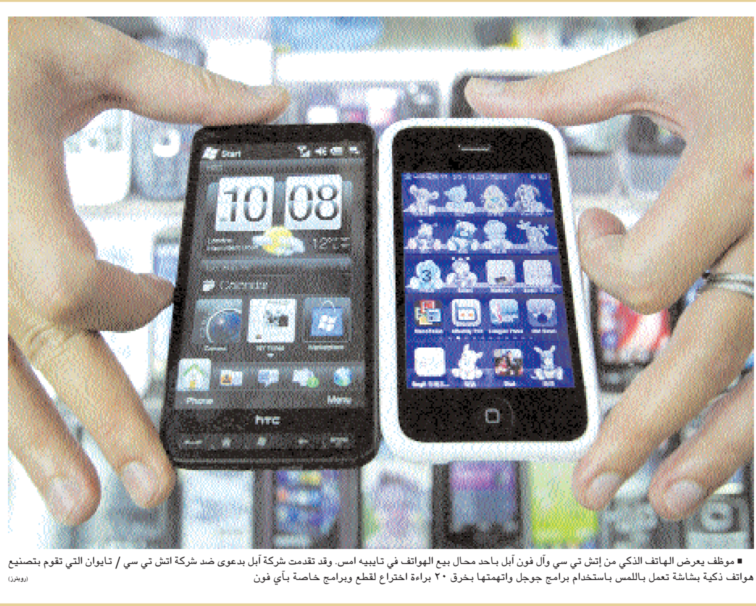
موظف يعرض الهاتف الذكي من إنش تي سي وآل فون أبل باحد محال بيع الهواتف في تايبيه امس. وقد تقدمت شركة ابل بدعوى ضد شركة انش تي سي / تايوان التي تقوم بتصنيع هواتف نوكيا تعمل باللمس باستخدام برنامج جوجل واتهمتها بخرق ٢٠ براءة اختراع لقطع وبرامج خاصة باي فون