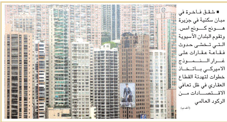
■ شقق فاخرة في مبان سكنية في جزيرة هونغ كونغ امس. وتقوم البلدان الآسيوية التي تخشى حدوث فقاعة عقارات على غرار النموذج الاميركي باتخاذ خطوات لتهدئة القطاع العقاري في ظل تعافي الاقتصادات من الركود العالمي