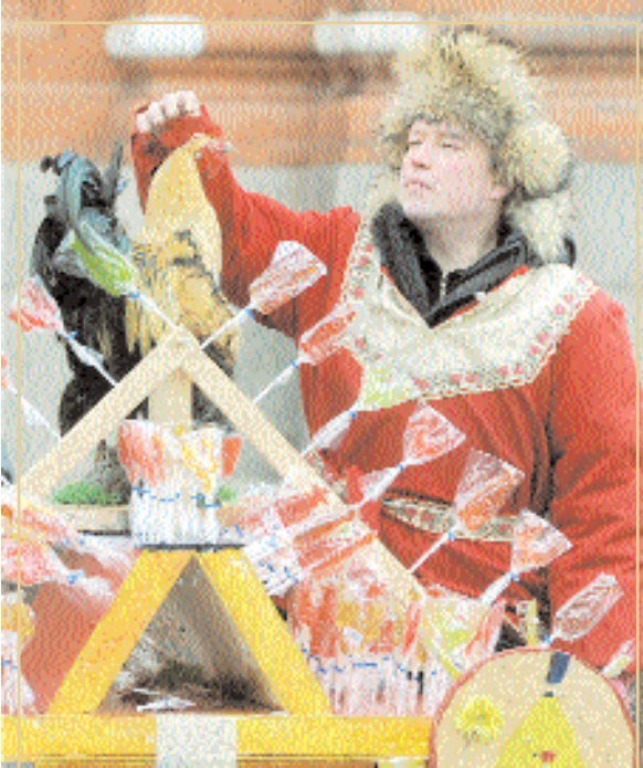
■ بائع روسي يعرض أنواعا من الطوى وسط موسكو امس

■ بكين - أ.ف.ب: افادت صحيفة "فايننشال تايمز" امس الأربعاء ان الصين يمكن ان تساعد مصر على انشاء منطقة استثمارية اقتصادية في السويس. ووضحت الصحيفة البريطانية نقلا عن وزير الاستثمارات المصري محمود محي الدين ان القاهرة تتفاوض مع "منطقة تيانجين للاقامة لنموذج مماثل قرب قناة السويس. وبموجب القانون المصري سيسمح للشركة الصينية بحيازة حصة تبلغ ٤٩٪ في مشروع منطقة السويس الاقتصادية الذي يقدر ان تبلغ قيمته الاستثمارية ١.٥ مليار دولار. ونقلت الصحيفة عن الوزير المصري محمود محي الدين قوله ان منطقة السويس الاقتصادية "ستكون الاولى من هذا النوع المرتبطة بمستثمر كبير". وقال ان "المفاوضات النهائية ستجري في وقت قريب جدا كما أمل". ولم يتسن الاتصال بمنطقة تيانجين للتنمية الاقتصادية والتكنولوجية. ■