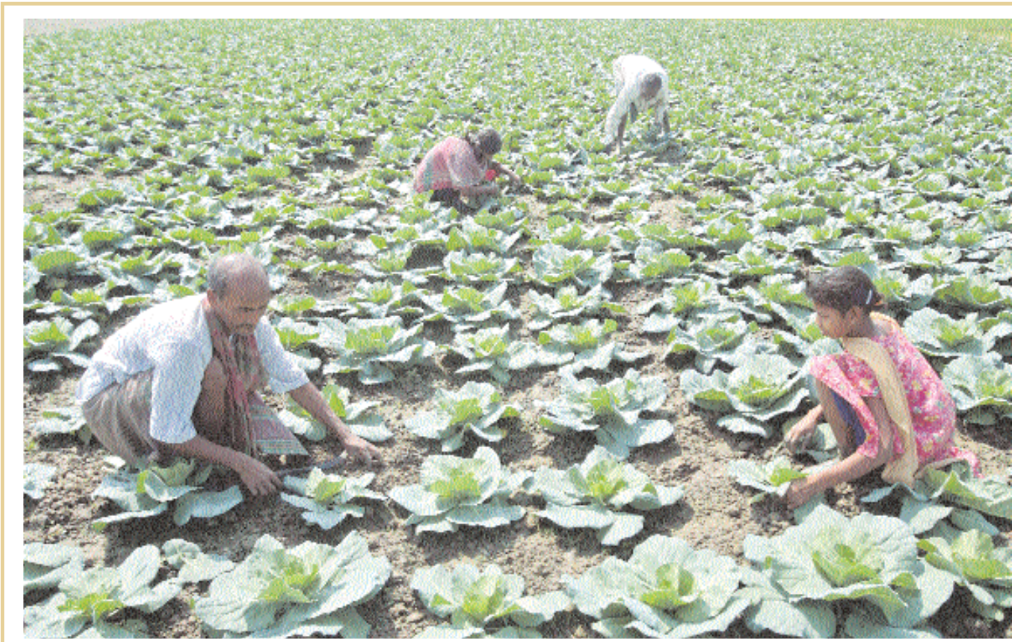
رويترز ■ مزارعون يعملون في حقل ملغوف بضواحي مدينة سيليجوري، شرق الهند امس

■ كوبنهاجن - (د ب أ): قالت شركة (مولر مايرسك) الدنماركية العملاقة للشحن والنظف امس إنها تكبدت خسائر صافية بقيمة مليار دولار للعام الماضي بأكمله مستشهدة (بالأسعار المتعدنية القياسية) لشحن الحاويات وانخفاض أسعار النفط وقالت المجموعة إن الأرباح الصافية لعام ٢٠٠٨ بلغت ٣,٥ مليار دولار. وسجلت الشركة العملاقة تراجعاً نسبته ٢١٪ في حجم الأعمال ليصل إلى ٤,٨ مليار دولار في العام الماضي. وقالت المجموعة التي تقوم بتشغيل شركة (مايرسك لاين) أكبر شركة لشحن الحاويات في العالم إن عمليات النقل البحري تراجعت بنسبة ١٪ خلال العام بينما تراجع متوسط أسعار الشحن بنسبة ٢٨٪ عن مستوى ٢٠٠٨. وقالت إن شحن الحاويات أضربت بشدة من الأزمة الاقتصادية العالمية عام ٢٠٠٩ وانكسرت بحوالي ١٣٪. وبلغ إجمالي أسطول المجموعة ٥٣١ ناقلة حاويات منها ٢٧٨ ناقلة تعمل بنظام النقل العارض. وخلال العام تم إخراج ١٩ ناقلة من الخدمة بما يعادل ٤٪ من الأسطول. كان سعر سهم المجموعة تراجع بنحو ٦٪ في بداية التعاملات على خلفية تلك الأنباء لكنه تعافى قليلاً ليخسر ٤٪ من قيمته. ■