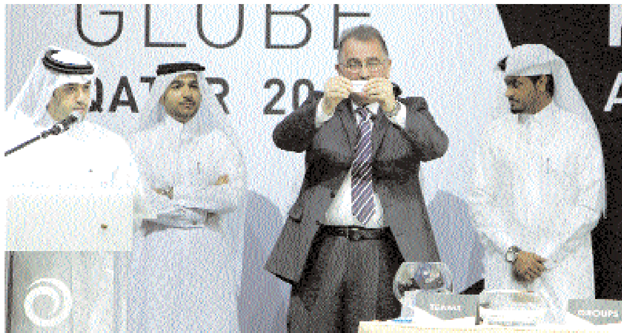
■ من سحب قرعة البطولة

أكد الدكتور حسن مصطفى رئيس الاتحاد الدولي لكرة اليد بانني لا يخافنا أي شك، في أن بطولة قطر الـ "سوبر جلوب" ٢٠١٠، سوف تحقق نجاحاً رائعاً، في المستوى التنظيمي كما في المستوى الفني التنافسي الذين سوف نشهدهما هنا من السابع عشر إلى الحادي والعشرين من شهر مايو القادم. ومع حضور أفضل ستة فرق في العالم في أروع منشآت رياضية قطرية يمكن أن يوفرها بلد مضيف، يمكننا أن نكون مطمئنين إلى أن كرة اليد ستكون هي الفائز الأكبر. وأضاف حسن مصطفى إن هذه البطولة تقوم على مفهوم جمع الناس، لاعبين ومشجعين من كافة أنحاء العالم. وقد فعلت قطر ذلك مراراً وتكراراً، مثيرة إعجاب العالم في الألعاب الآسيوية عام ٢٠٠٦، حدث رائع امتعنا أيضاً بمسابقة متميزة في كرة اليد، وكذلك في مناسبات عديدة أخرى. كما أن قطر قد سبق لها أن استضافت بطولة الاتحاد الدولي لكرة اليد، الـ "سوبر جلوب"، في العام ٢٠٠٢، حين حقق فريق النادي المضيف، نادي السد، إنجازاً لا ينسى، بفوزه بالدورة على أرضه، ثم قامت الدوحة باستضافة بطولة العالم للشباب عام ٢٠٠٥، وكنا راضين عن النتائج بصورة كبيرة. ■