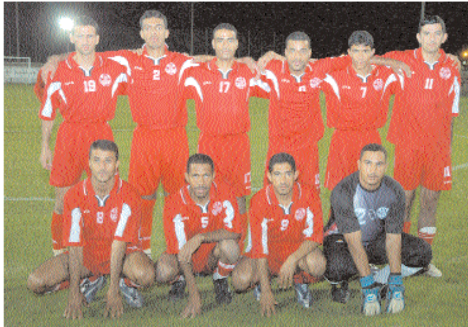
■ الفريق الكروي بنادي الحمراء