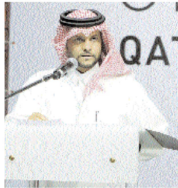
■ سعود بن عبد الرحمن آل ثاني يلقي كلمة في حفل تدشين الشعار