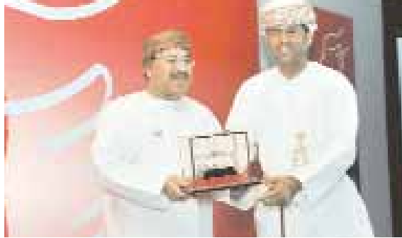
من تكريم الشركات الفائزة