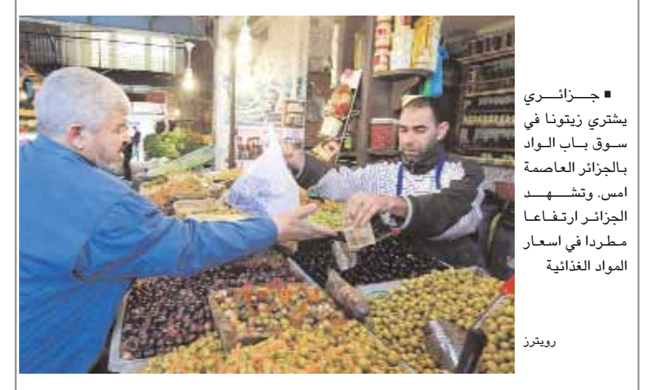
■ جزائري يشتري زيتونا في سوق باب الواد بالجزائر العاصمة امس. وتشهد الجزائر ارتفاعا مطردا في اسعار المواد الغذائية

■ لندن - رويترز: ارتفع سعر الذهب في أوروبا أمس الأربعاء بدعم من استمرار حالة عدم اليقين بشأن سلامة الأوضاع المالية في بعض دول منطقة اليورو لكن الارتفاع الطفيف للدولار حد من مكاسب المعدن الأصفر. وارتفعت معنويات المستثمرين بفضل الانتعاش السريع للمعدن الأصفر من أقل مستوى له خلال جلسة أمس الأول الثلاثاء عند أقل من ١١١٠ دولارات للأوقية (الأونصة). ولم يبلغ سعر الذهب في السوق الفورية ١١٢٣,٠٠ دولار للأوقية بالمقارنة مع ١١٢١,١٥ دولار عند إغلاقه السابق في نيويورك أمس الأول. وبلغ سعر الفضة ١٧,٣٢ دولار للأوقية مقارنة مع ١٧,٢٣ دولار. وارتفع البلاتين إلى ١٥٩٦ دولار للأوقية من ١٥٨٩ دولار وبلغ سعر البلاتينوم ٤٦٧ دولارا ارتفاعا من ٤٦٥ دولار للأوقية في نيويورك. ■