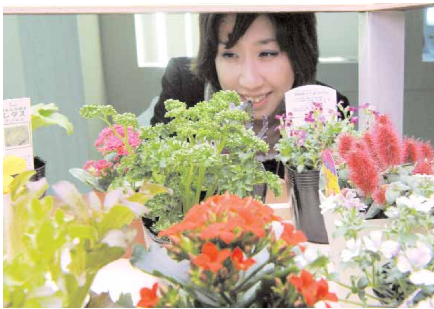
■ عارضة تقدم وحدة «صمام ثنائي باعثة للضوء» من ستانلي إلكترونيك لمصانع النباتات لزراعة الخضراوات والزهور وذلك في معرض لاضواء الصمامات الثنائية «دايودز» الباعثة للضوء في طوكيو امس. حيث تستخدم تلك التقنية صمامات ثنائية باعثة للضوء بيضاء وحمراء لتسريع عملية التمثيل الضوئي للنباتات