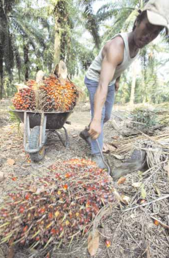
■ عامل يجمع ثمار زيت النخيل في مزرعة في سيبانج خارج كوالالمبور امس. ومن المتوقع ارتفاع أسعار زيت النخيل للأجل من (٤٨٠ - ٩٦٢) دولارا بعد يوليو بسبب ارتفاع درجات الحرارة الحالية في خفض الانتاج في النصف الثاني من ٢٠١٠

■ لندن - رويترز: أخفق النفط في العثور على قوة دفع في أي اتجاه للتحرك بعيدا عن مستوى ٨١,٥٠ دولار امس الأربعاء فيما يتربص مستثمرون التقرير الشهري لمنظمة أوبك قبل اجتماعها الأسبوعي المقبل. واستقر سعر عقود النفط الخام الأميركي الخفيف تسليم أبريل عند ٨١,٤٩ دولار للبرميل. وكان قد ارتفع في وقت سابق نحو ٨٠ سنتا من دروته التي بلغها يوم الاثنين عند ٨٢,٤٩ سنت وهو أعلى مستوى له منذ قفزت الأسعار في ١١ يناير مسجلة ٨٣,٩٥ دولار في أقوى أداء للخام في ١٥ شهرا. وارتفع سعر عقود النفط الخام برنت في لندن سبعة سنتات إلى ٧٩,٩٨ دولار للبرميل. وأظهرت بيانات معهد البترول الأميركي امس الأول الثلاثاء أن مخزونات الخام الأميركية قفزت ٦,٥ مليون برميل في الأسبوع المنتهي في الخامس من مارس مقارنة بتوقعات المحللين بزيادة قدرها ١,٩ مليون برميل. كما تلقت الأسعار دعما من الصين حيث عززت بيانات واردات النفط دلائل على أن الاقتصادات الآسيوية ستقود نمو الطلب العالمي هذا العام. ■