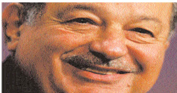
(مليار دولار، 2010)

أصبح الملياردير كارلوس سليم الحلو (70 عاماً) الأكثر ثراء في العالم. وقد انتزع رجل الأعمال المكسيكي من أصل لبناني اللقب من بيل غيتس - أقوى شخص في العالم العام الماضي - بفترة تزيد عن ثروة مؤسس مايكروسوفت بنحو 500 مليون دولار