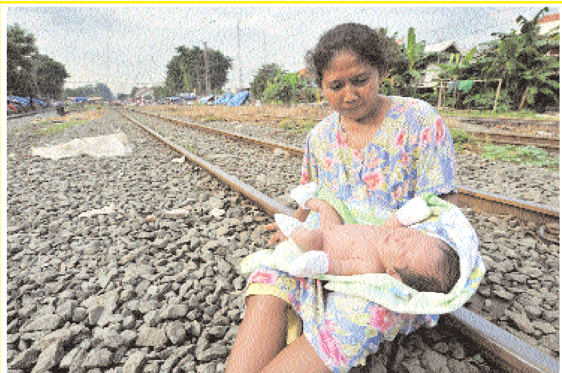
■ اندونيسية تجلس بطفها حديث الولادة على السكك الحديدية في جاكرتا أمس، حيث تقوم كثير من الأسر المهمة التي تعيش في حالة من الفقر ببناء مأوى غير قانوني على طول الطرق الحديدية في منطقة العاصمة وضواحيها وقد بلغ عدد العائلات التي تعيش على طول السكك الحديدية في وسط جاكرتا وحدها أكثر من ٥ آلاف عائلة حسب تقرير لوزارة الاسكان الاندونيسية.

■ واشنطن - (أ ف ب) - انتهت العائلات الأميركية العام ٢٠٠٩ أكثر ثراء مما بدأت، وذلك للمرة الأولى منذ العام ٢٠٠٧، بحسب جداول المحاسبة الوطنية التي نشرها الاحتياطي الفدرالي الأميركي الخميس الماضي، وظهرت هذه الجداول ان الثروة الصافية للأسر الأميركية، التي تمثل الفارق بين أصولها وديونها، وصل الى ٢,٥٤١٧٦ مليار دولار في نهاية ديسمبر بزيادة ٤,٥٪ عما كانت عليه قبل عام، وأوضح الاحتياطي الفدرالي ان عملية تصفية ديون الأسر التي بدأت في ربيع ٢٠٠٨ تسارعت عام ٢٠٠٩ وقابلها تزايد املاكها، وكتب الاحتياطي الفدرالي ان "ديون الأسر تراجعت بنسبة ٧٥,١٪" عام ٢٠٠٩، في أول تراجع سنوي لديون الأميركيين منذ ١٩٤٦ على اقل تقدير. غير ان مستوى الباحثين عن عمل الذي ازاد ٣,٢ نقطة عام ٢٠٠٩ ليصل الى ١٠,١٪ في ديسمبر (مقابل ٧,٩٪ حاليا)، فيشير الى ان الثروة لا تتوزع بشكل متساو.