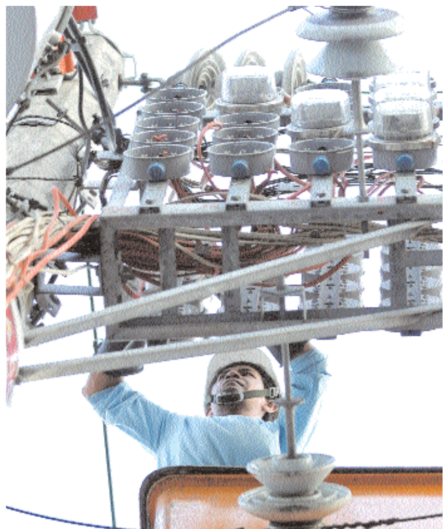
■ عمال من شركة كهرباء مانيتا يركبون عدادات كهرباء في أحد أحياء مانيتا أمس وكانت موجة الجفاف الحاد قد تسببت في حدوث أزمة طاقة في اللبيين تمثلت في انقطاعات طويلة ومتكررة للتيار الكهربائي في العاصمة مانيتا.

■ فيسبادن (ألمانيا) - (د ب أ) - أظهرت الاحصائيات أن المواطنين الألمان أنفقوا خلال العام الماضي ٢٠٠٩ نحو ٧٣ مليار يورو على شراء السيارات بزيادة نسبتها ٢,٥٪ مقارنة بعام ٢٠٠٨. وذكر مكتب الاحصاء الاتحادي أمس الجمعة أن الارتفاع الكبير في معدلات انفاق الألمان على شراء السيارات هو الرغبة في الاستفادة من برنامج الدعم الحكومي بمنح ٢٥٠٠ يورو لكل شخص يريد شراء سيارة صديقة للبيئة مقابل قيامه بتسليم سيارته القديمة التي يعود تاريخ انتاجها إلى أكثر من ٩ سنوات وكان العام الماضي ٢٠٠٩ قد شهد ارتفاعا في معدلات انفاق المستهلك الألماني بصفة عامة بنسبة ٤,٥٪ مقارنة بعام ٢٠٠٨. وأشارت الاحصائيات إلى أن ارتفاع معدلات انفاق على شراء السيارات في ألمانيا ساهم في ارتفاع معدلات انفاق المستهلكين بصفة عامة ولولا الاقبال على شراء السيارات لتراجع الانفاق الاستهلاكي بألمانيا بنسبة ٥,٥٪.