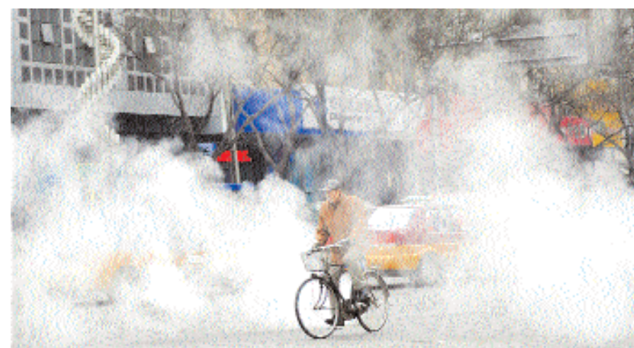
■ دراج صيني يمر بشارع غطاء البخار المتصاعد من بالوعات المجاري في بكين أمس الأول وقد أعلن مسئول كبير أن الوضع البيئي للصين لا يزال يتدهور وذلك لأن النمو الاقتصادي للصين يؤدي إلى حرق كميات كبيرة جدا من الفحم.