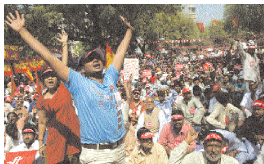
■ آلاف الهنود يشاركون في مسيرة احتجاجا على ارتفاع أسعار السلع الأساسية والمنتجات النفطية في نيودلهي أمس.